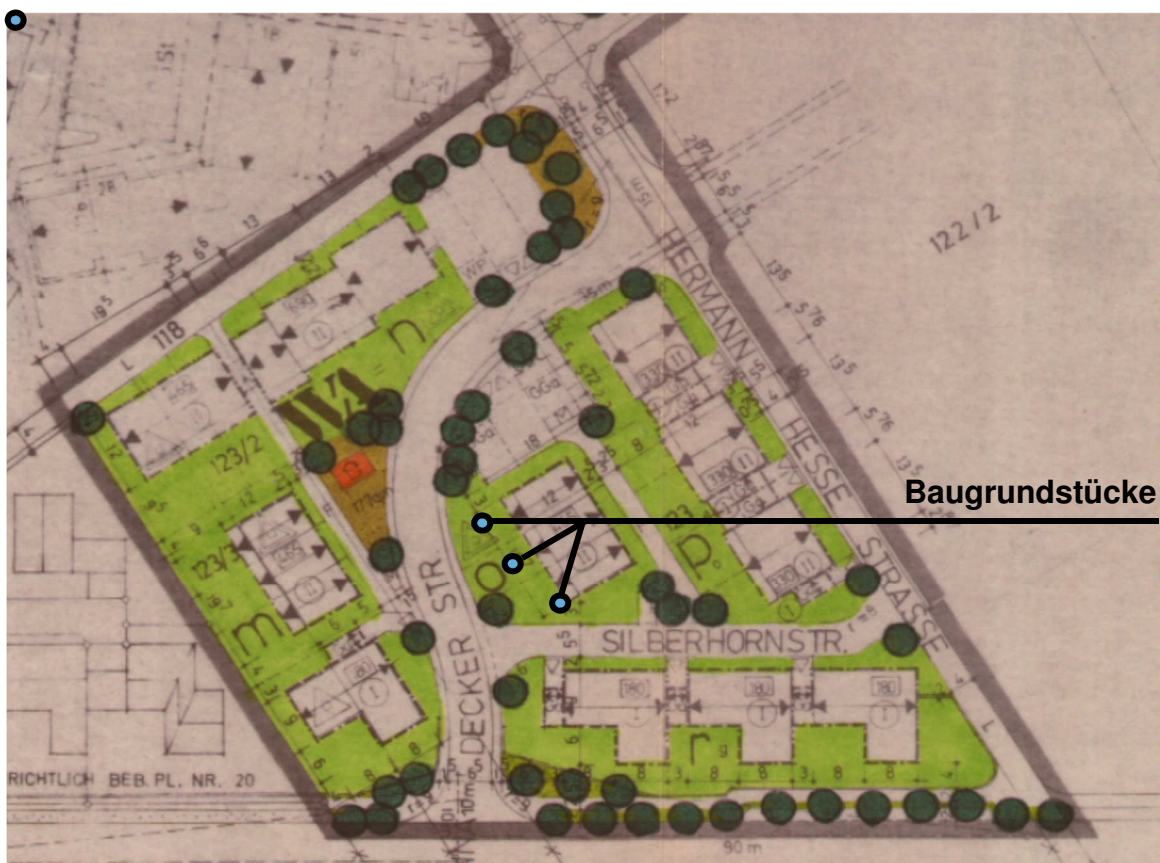
Ausschnitt der Planzeichnung des Grünordnungsplans des Bebauungsplans Nr. 30