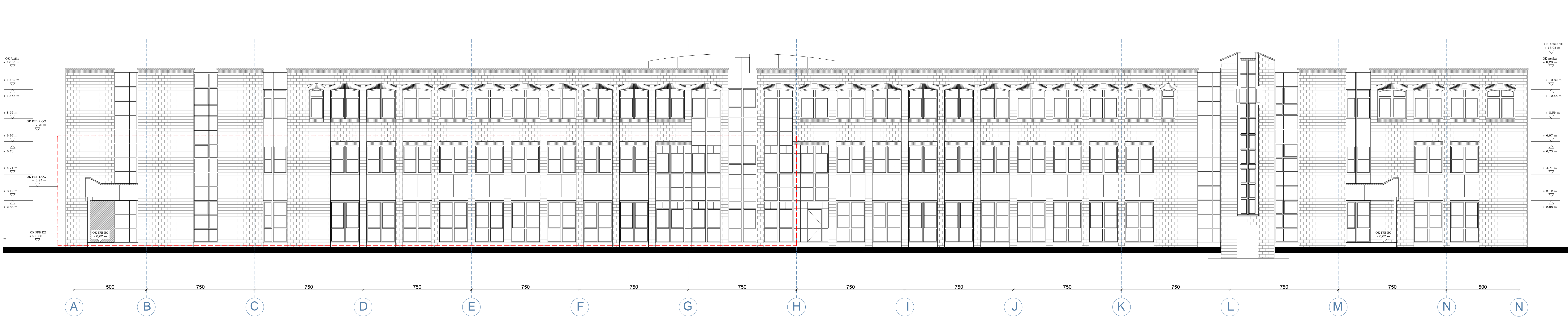
Ansicht Nord-Ost Bestand - Planung M 1:100

Es werden keine Änderungen an der Fassade vorgenommen!