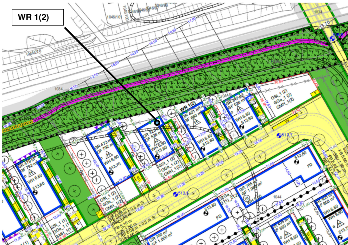
Ausschnitt Bebauungsplan Nr. 100