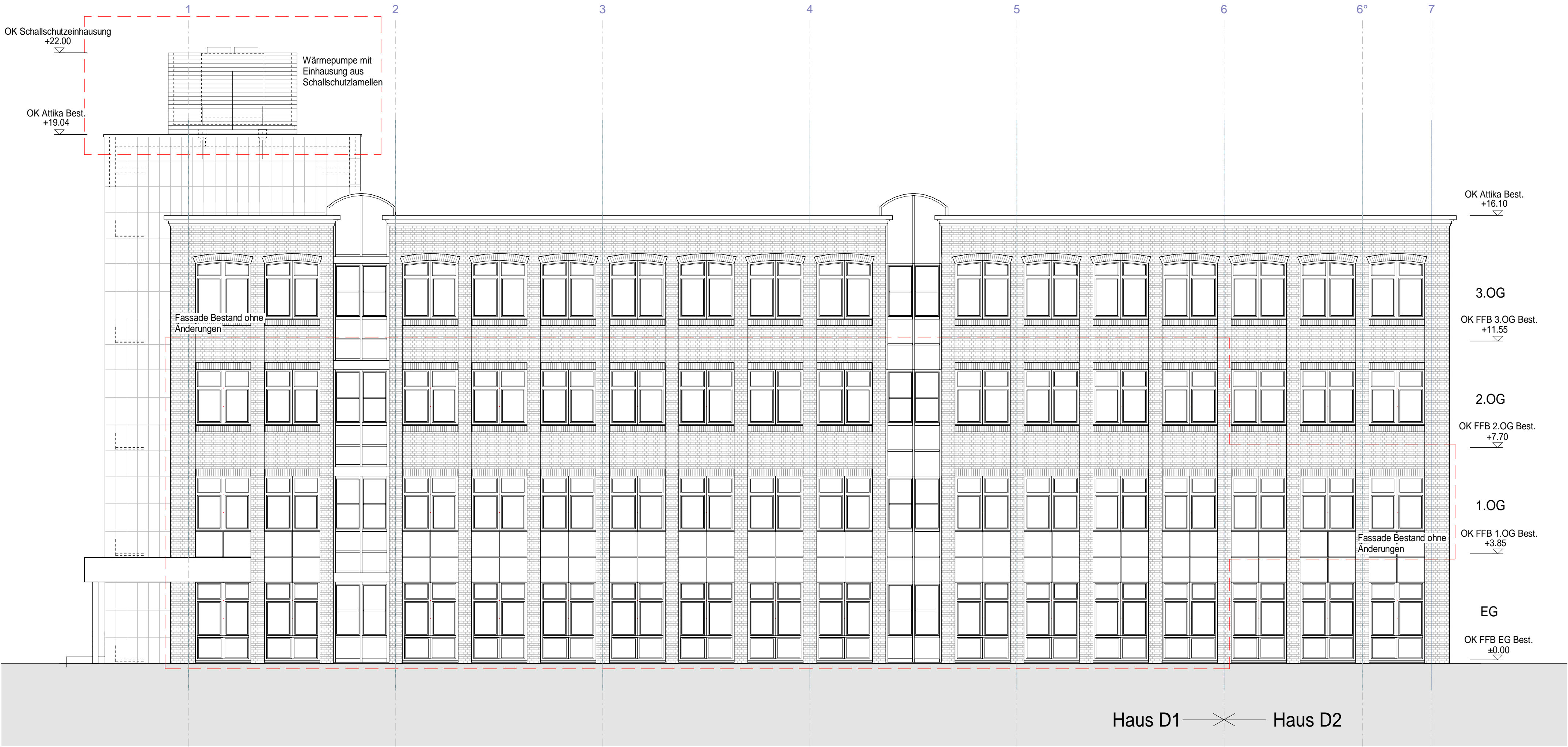
Ansicht Süd- Ost (Bestand)