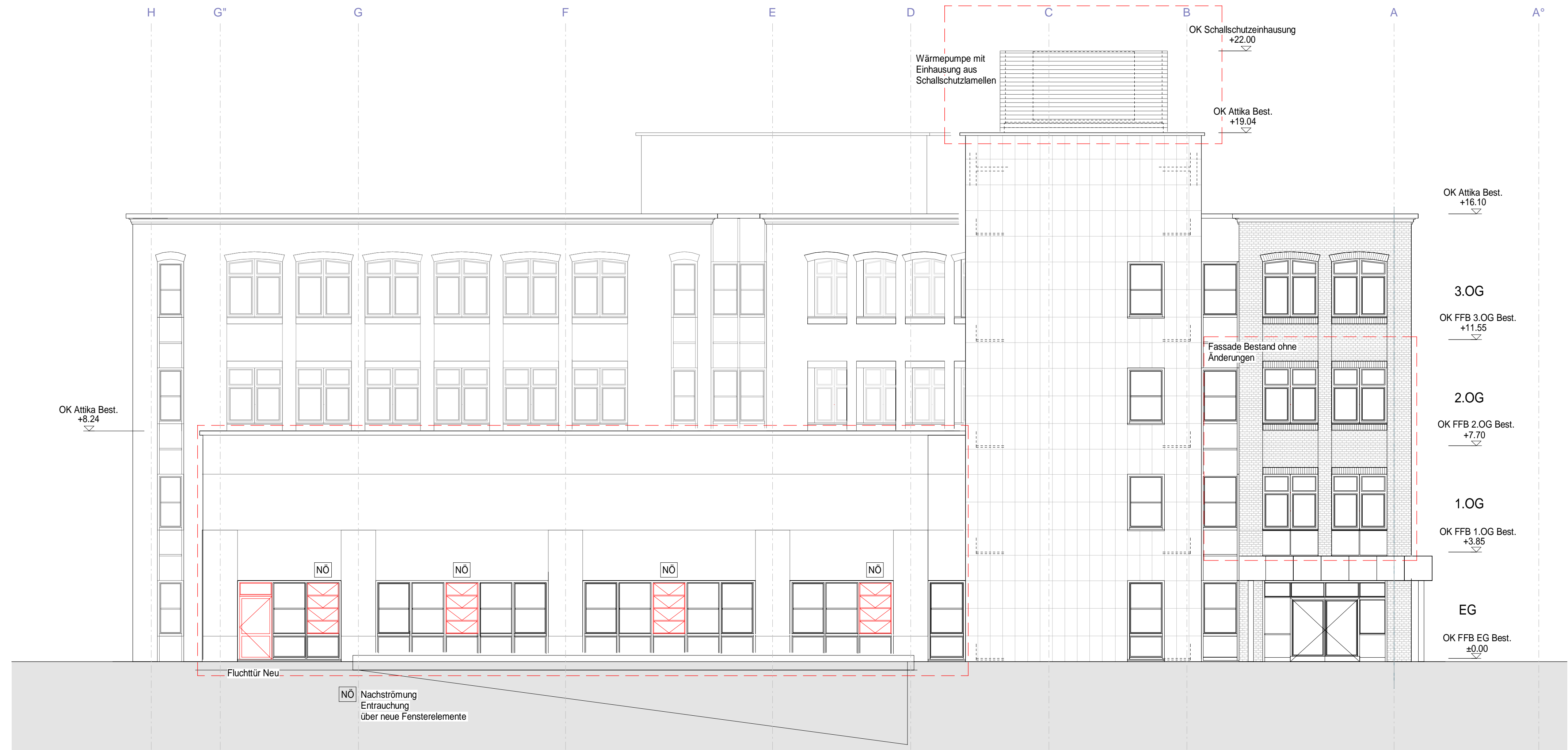
Ansicht Süd- West