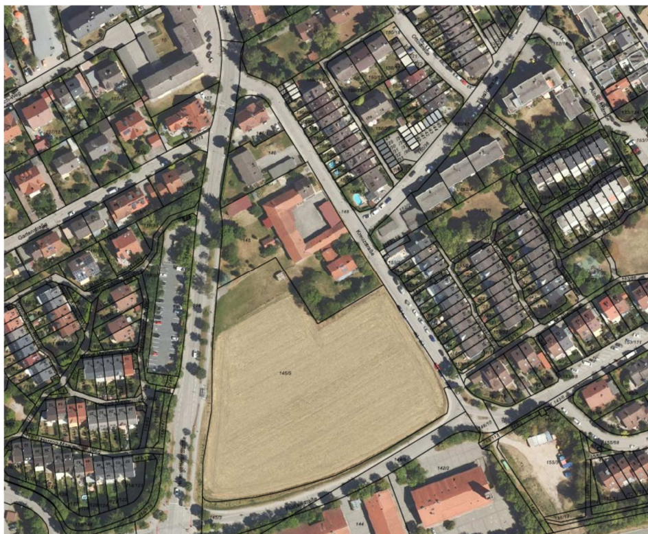
Luftbild mit Flurkartenausschnitt