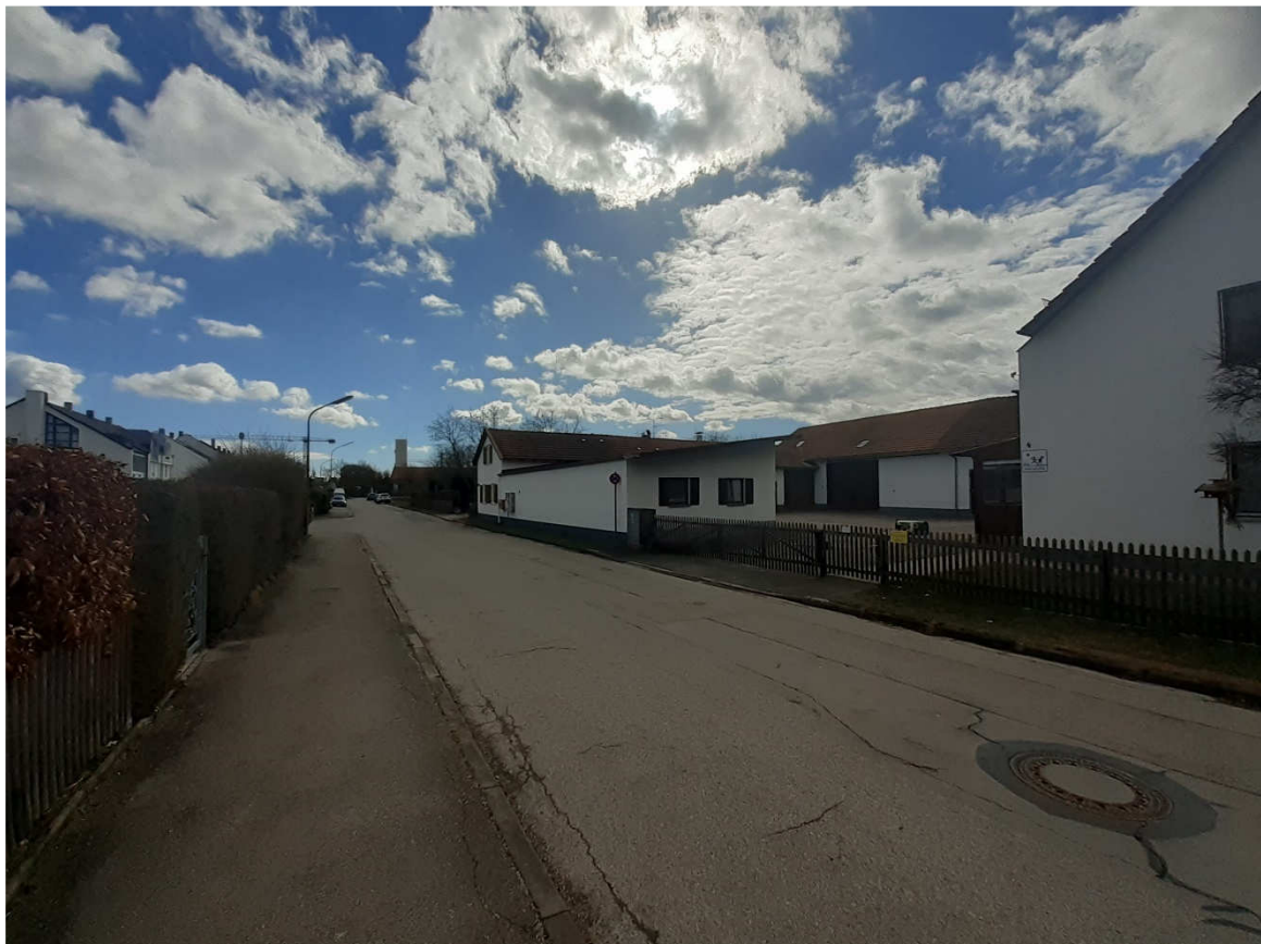
Ansicht Kreuzstraße aus nördlicher Richtung