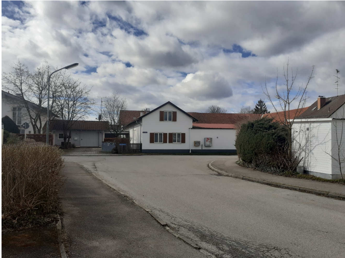
Ansicht Bestandsgebäude aus östlicher Richtung