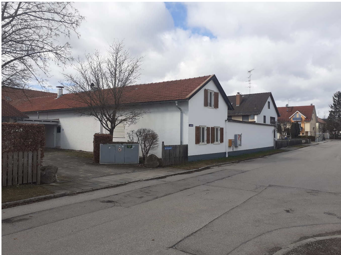
Ansichten Kreuzstraße aus südlicher Richtung