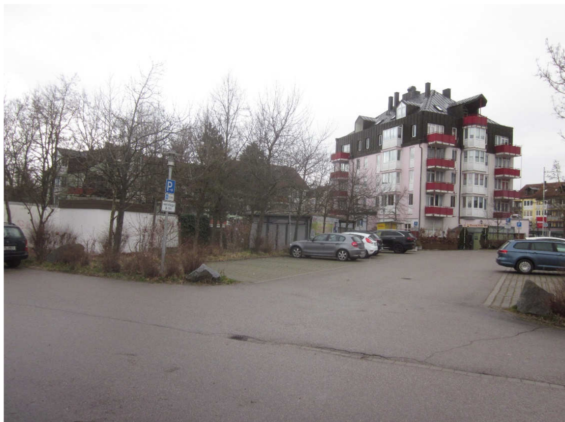
Ansicht der Stellplätze für die Schnellladestation aus westlicher Richtung