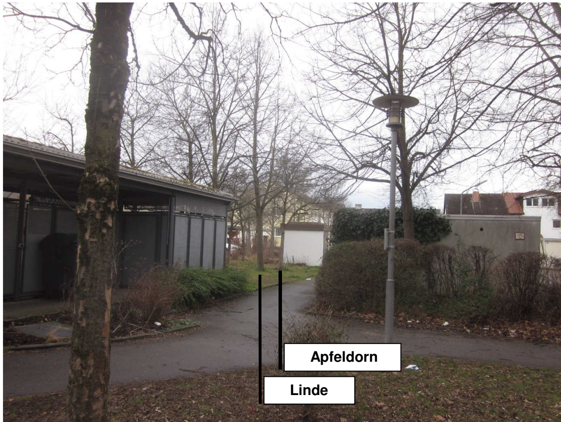
Ansicht der Bäume aus westlicher Richtung