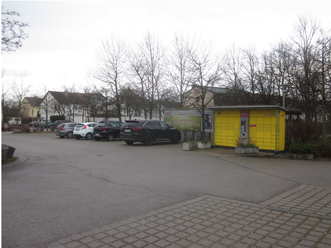
Ansicht der Stellplätze für die Schnellladestation mit DHL-Packstation aus östlicher Richtung