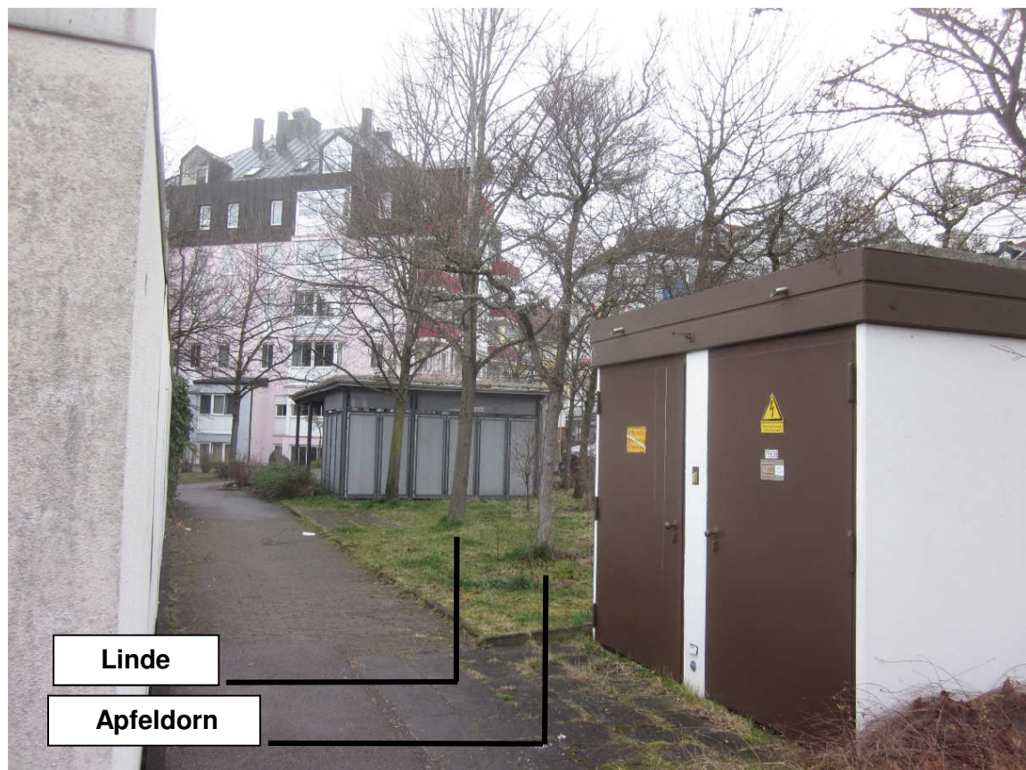
Ansicht der Bäume aus westlicher Richtung