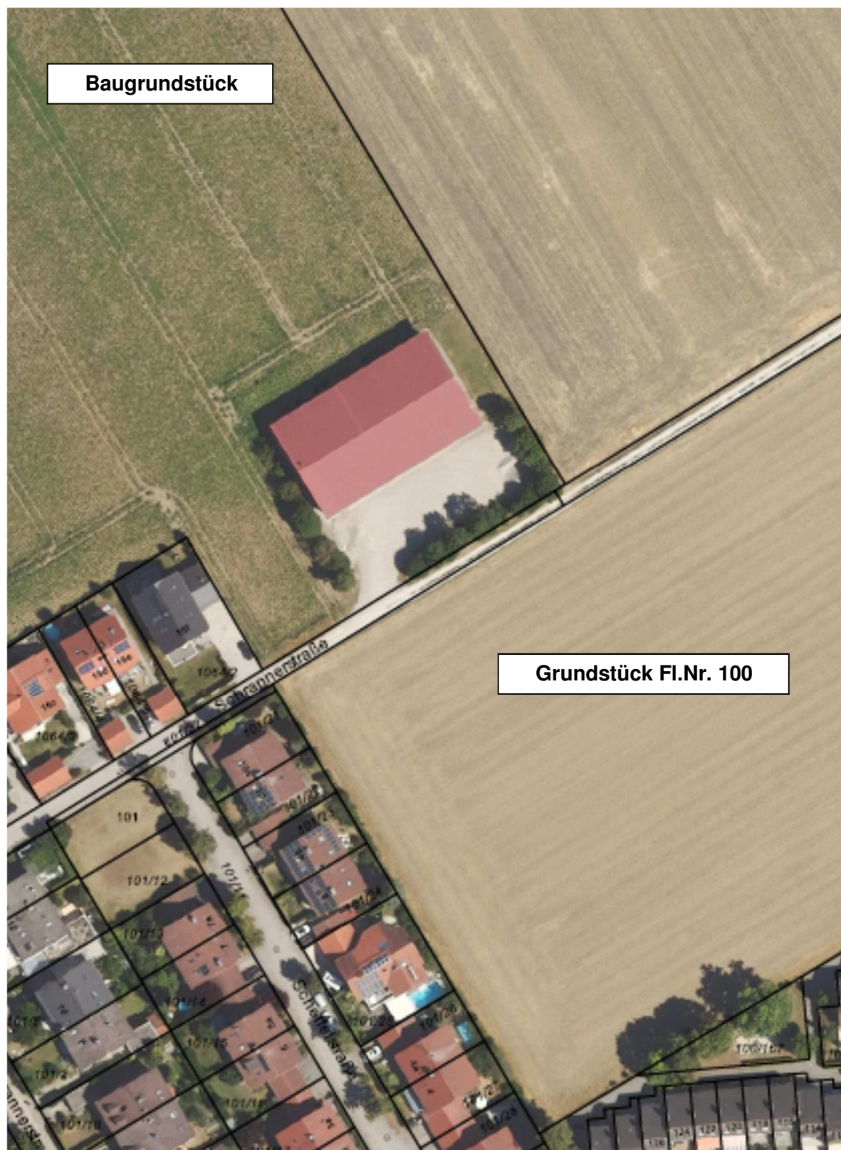
Flurkartenausschnitt mit Luftbild