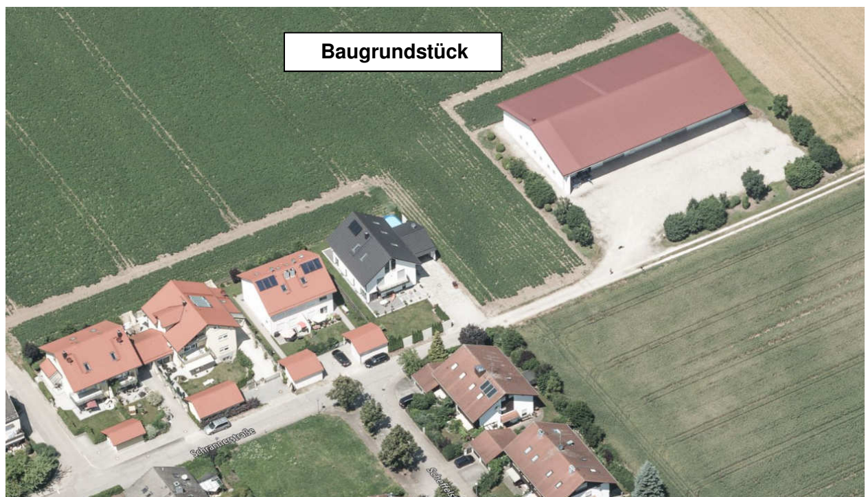
Luftbildisometrie mit Bestandsgebäuden