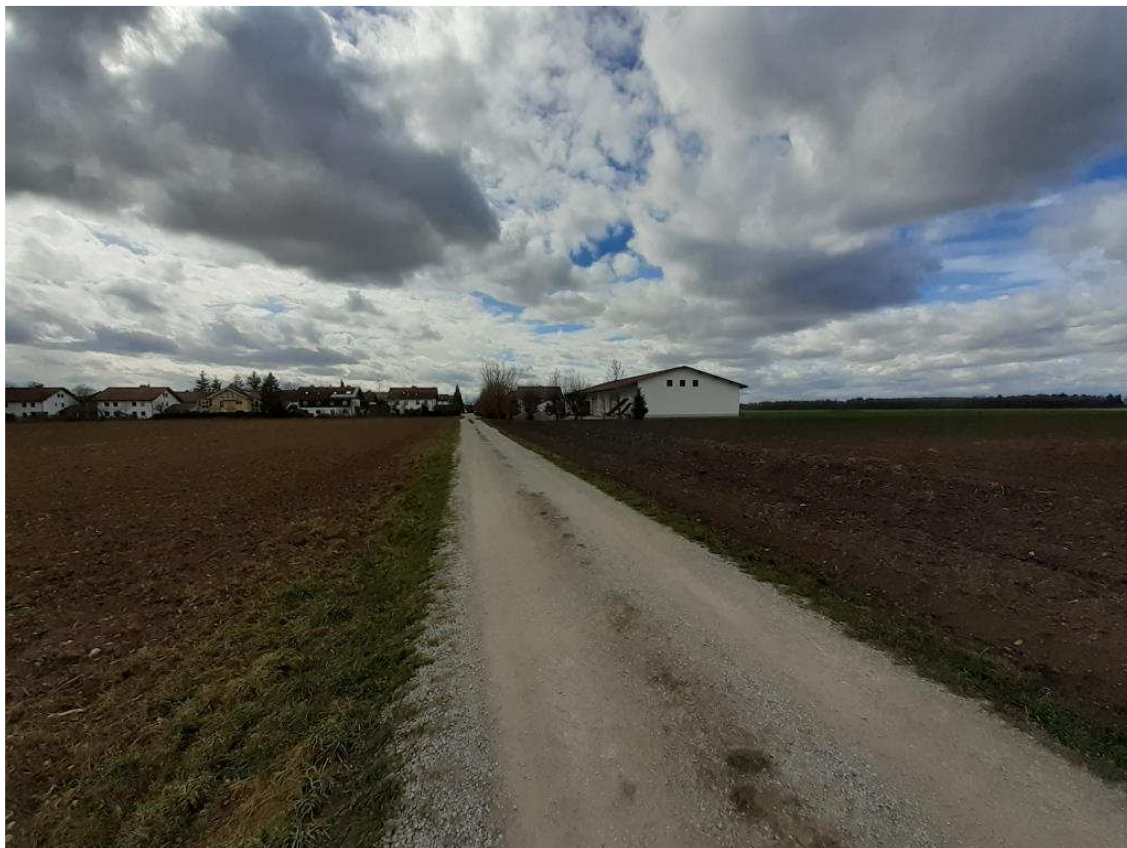
Ansicht des Bestandsgebäudes und der Schranerstraße aus östlicher Richtung vom Feldweg