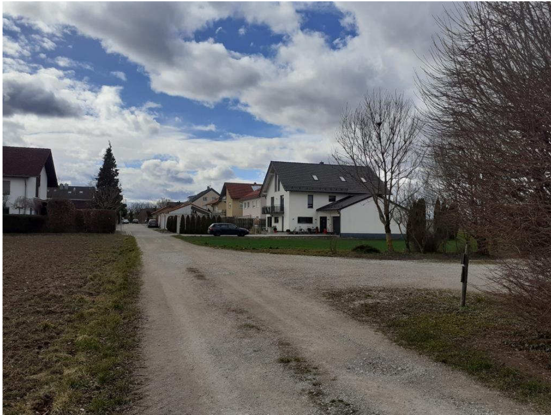
Ansicht der Schranerstraße und der Zufahrt zum Baugrundstück aus östlicher Richtung vom Feldweg