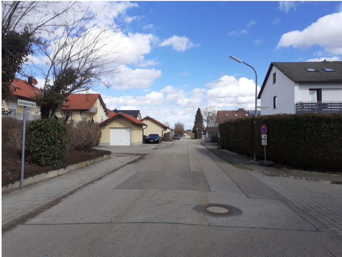
Ansicht der Schranerstraße aus westlicher Richtung (Höhe Schranerstraße 7)