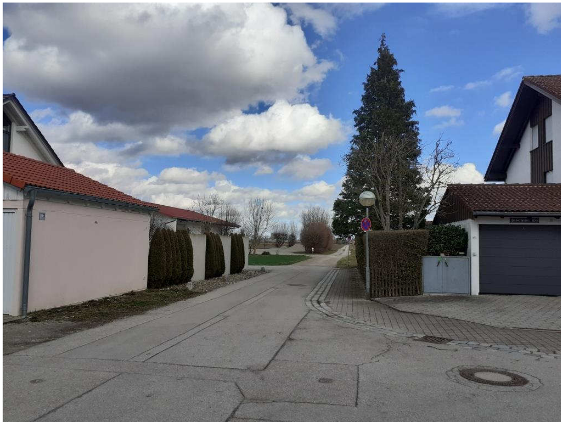
Ansicht der Schranerstraße und der Zufahrt zum Baugrundstück aus westlicher Richtung (Höhe Einmündung Scheffelstraße)