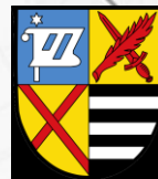
Kirchheim b. München