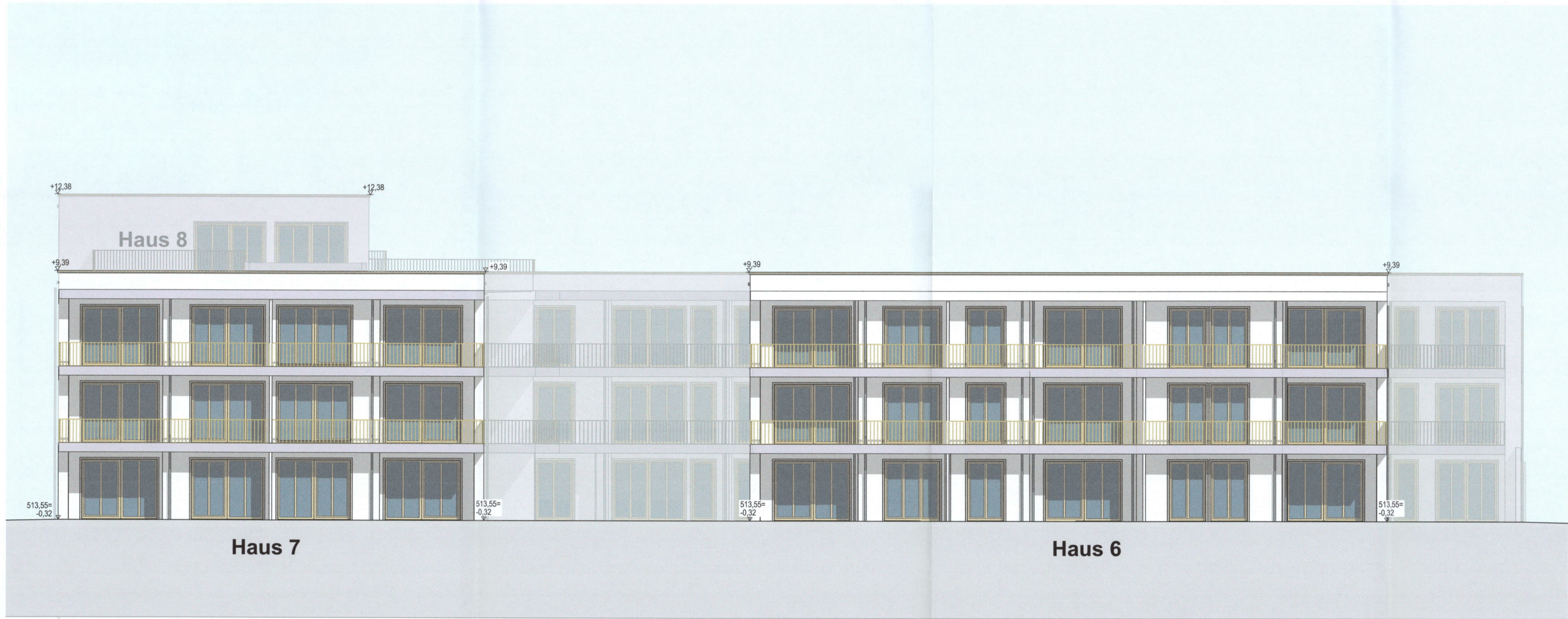
Ansicht Süd Haus 6 + 7