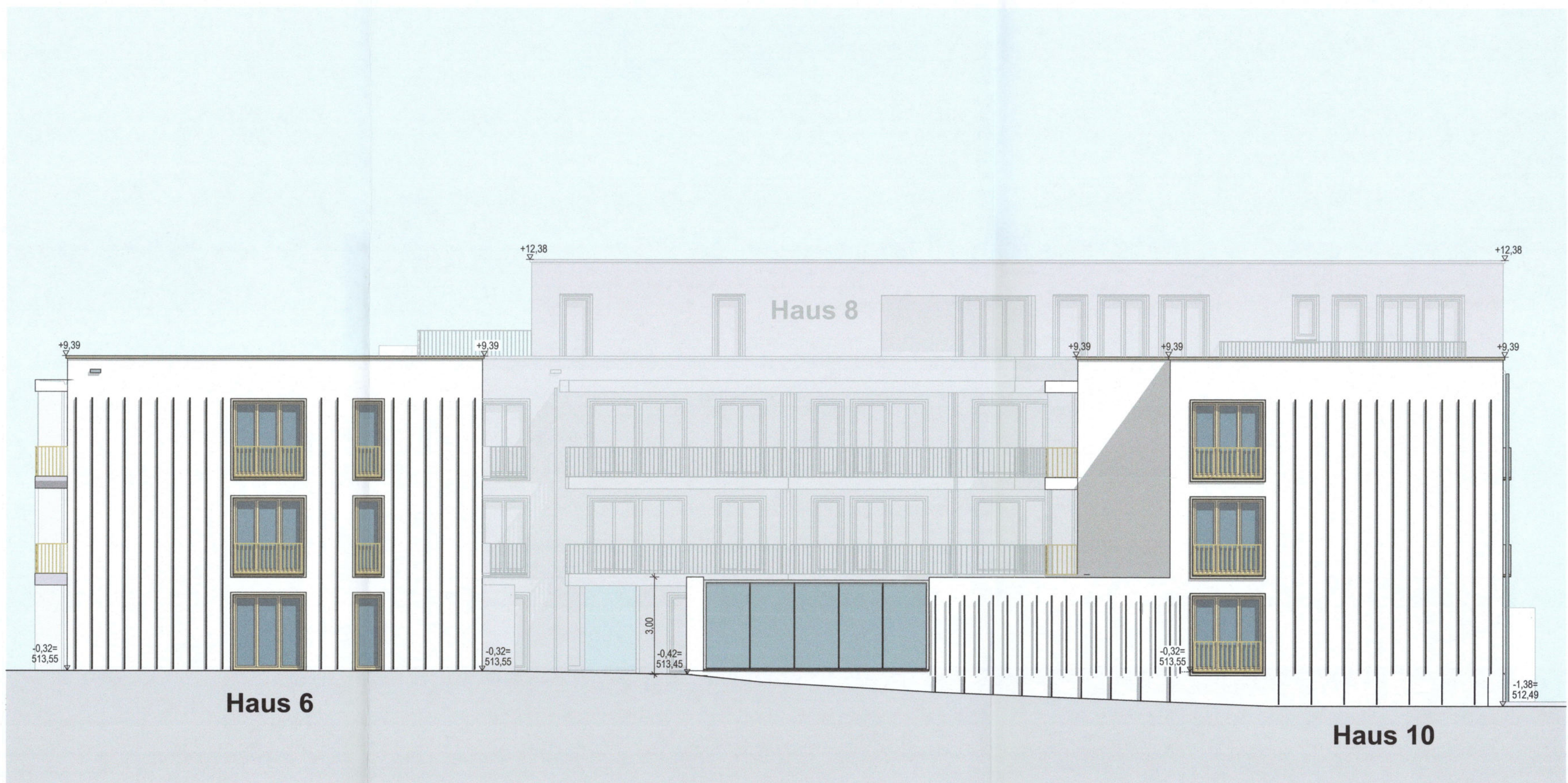
Ansicht Ost Haus 6 + 10