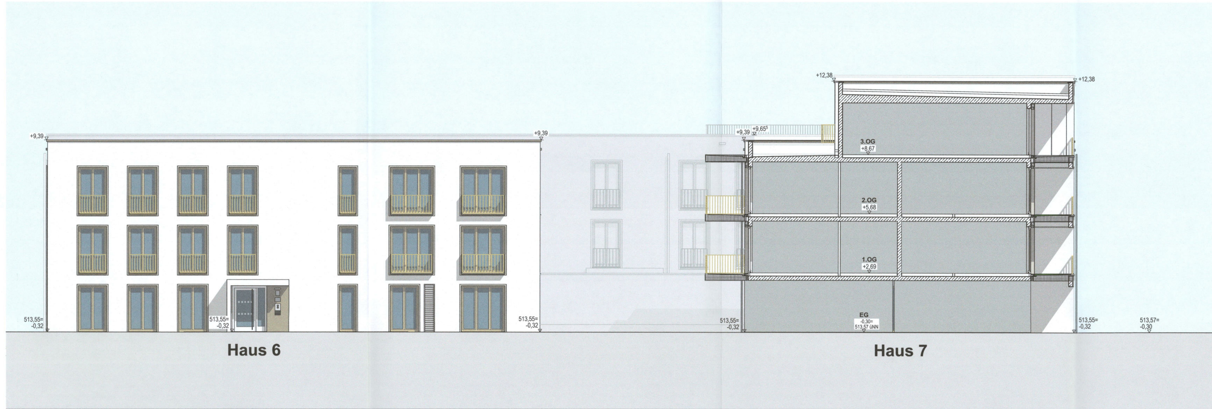
Ansicht Nord Haus 6 + Schnitt Haus 7