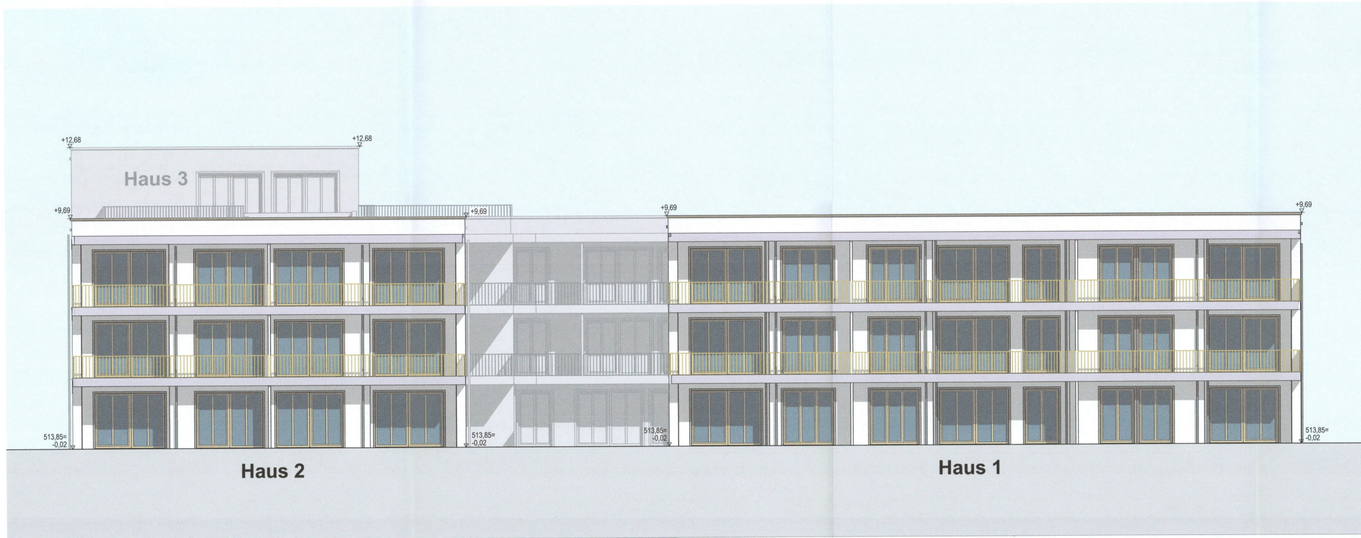
Ansicht Süd Haus 1+2