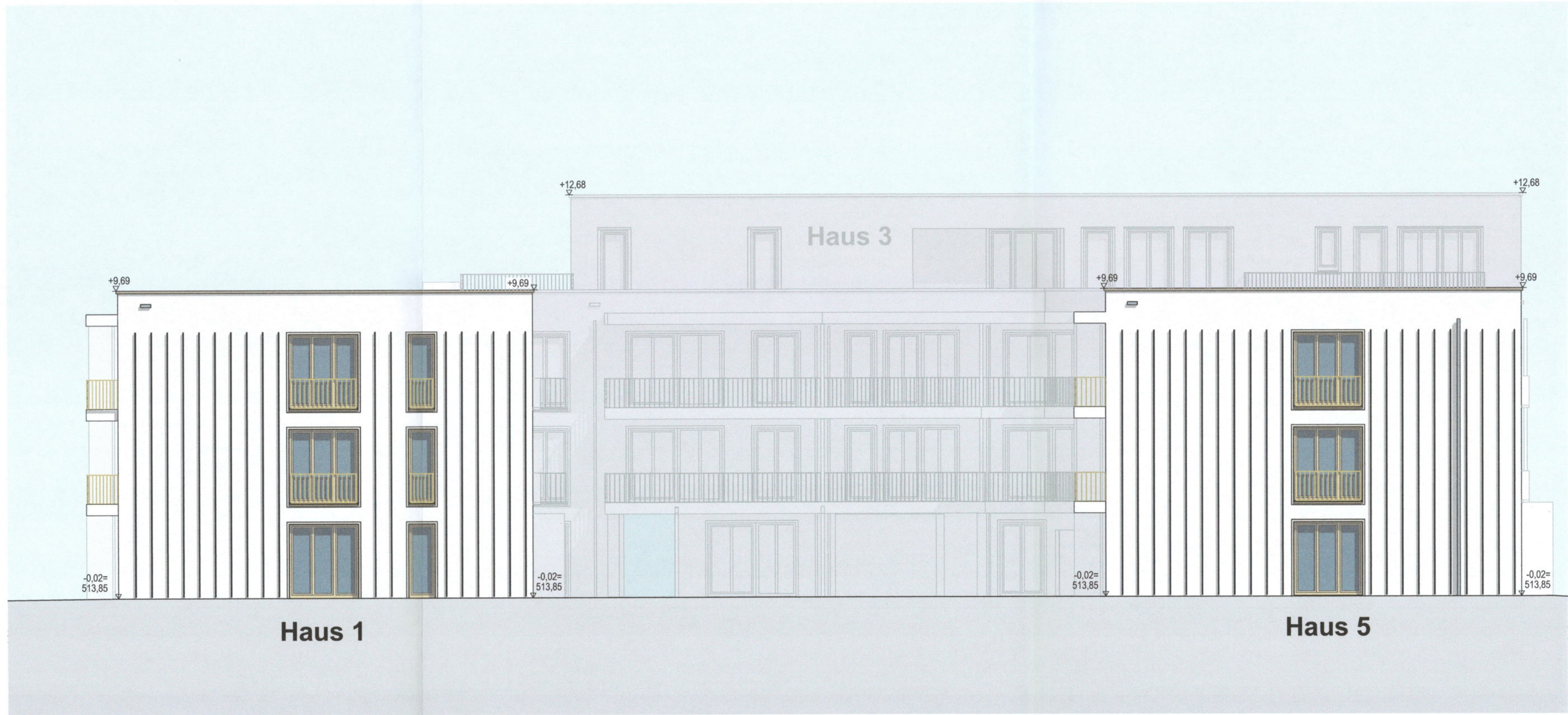
Ansicht Ost Haus 1+5