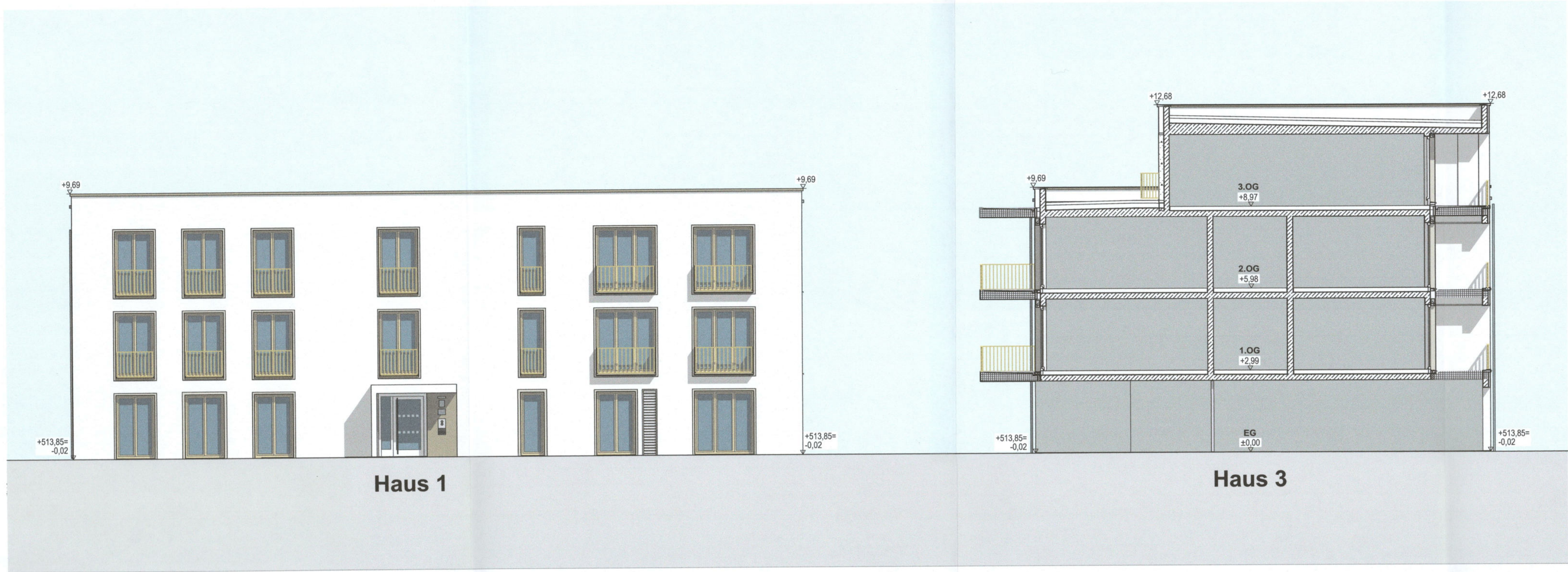
Ansicht Nord Haus 1 + Schnitt Haus 3