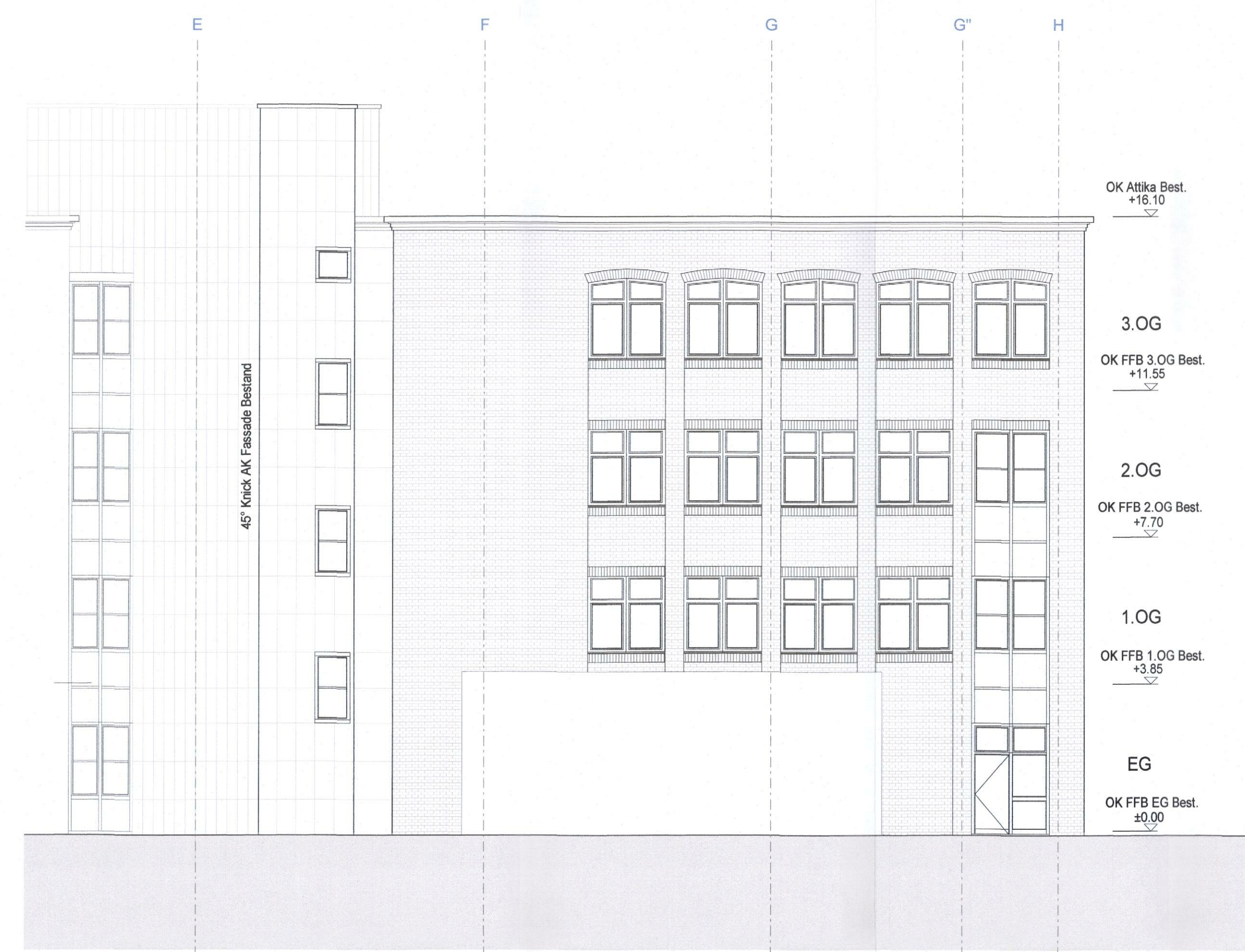
Ansicht Nord- Ost (Bestand)