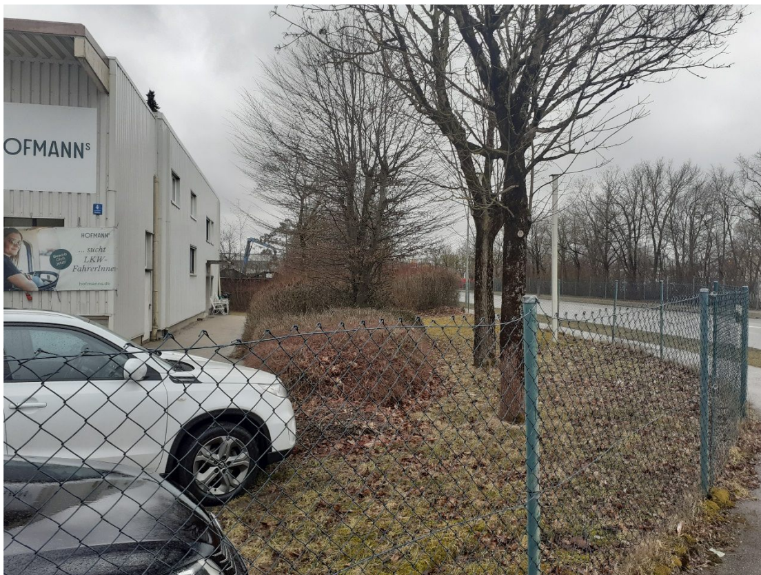
Ansicht Boschstraße 4 von der Oskar-von-Miller-Straße aus nördlicher Richtung