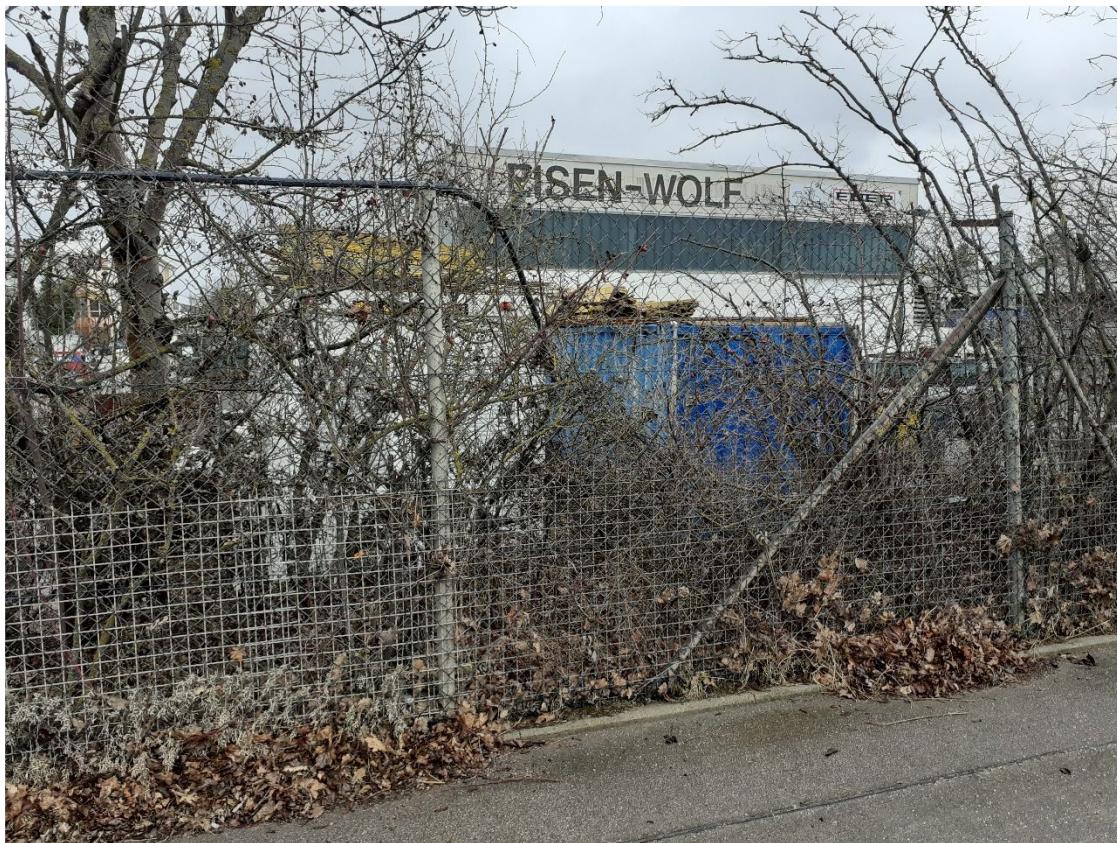
Ansicht Daimler Straße 8 von der Oskar-von-Miller-Straße aus westlicher Richtung