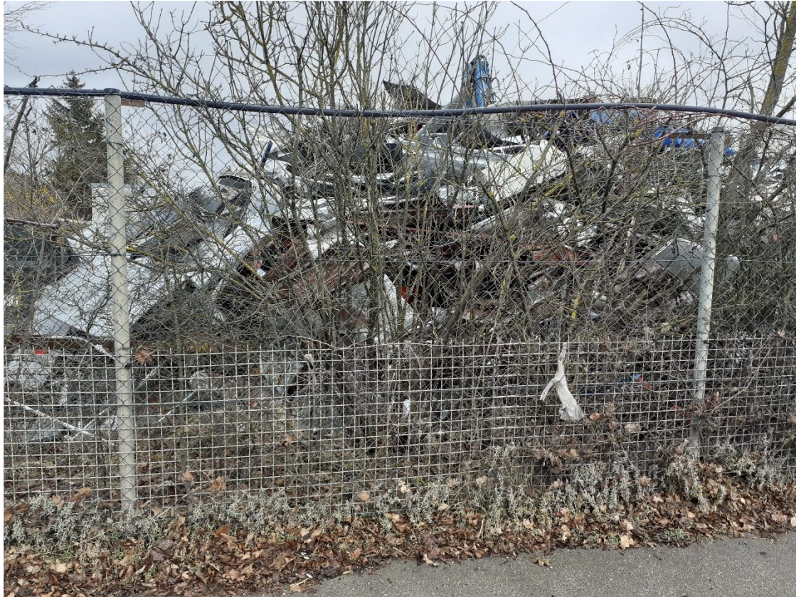
Ansicht Baugrundstück von der Oskar-von-Miller-Straße aus westlicher Richtung