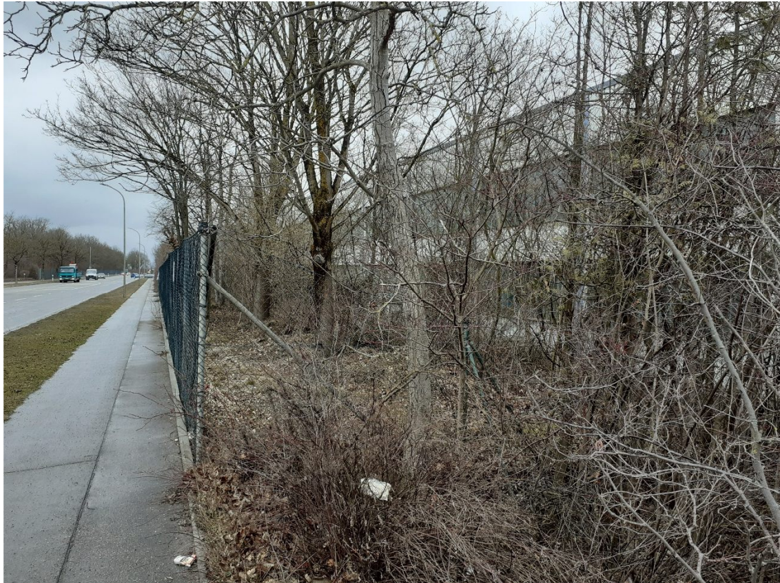
Ansicht Daimler Straße 10 von der Oskar-von-Miller-Straße aus südwestlicher Richtung