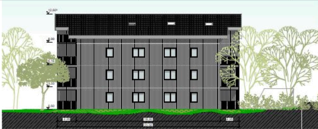
A-03 Ansicht Ost Haus 52A 1:100