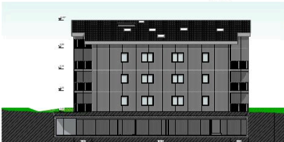
A-05 Ansicht West Haus 52B 1:100