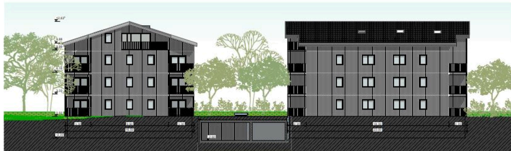
A-04 Ansicht West 1:100