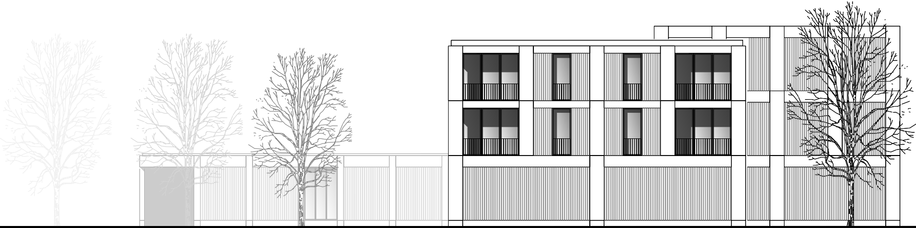
Ansicht West M 1_200