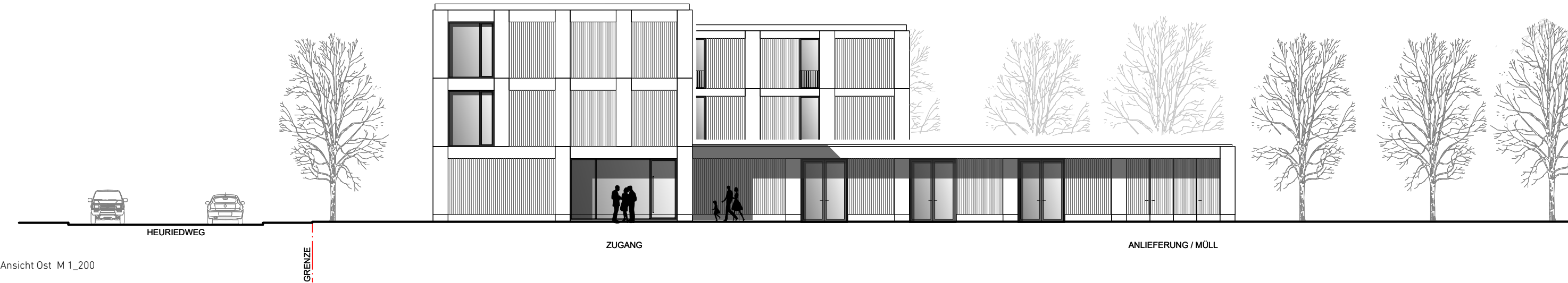
Ansicht Ost M 1_200