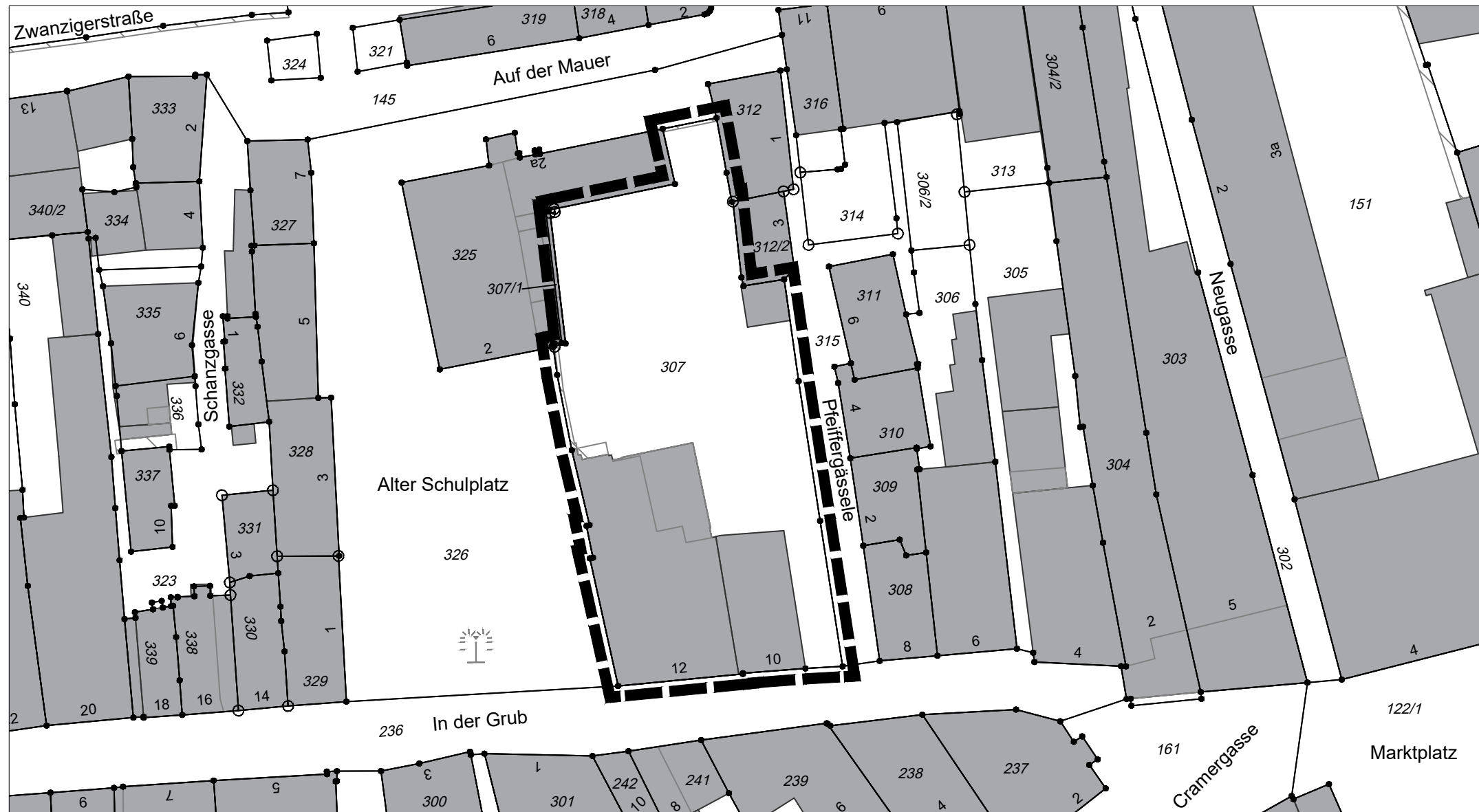
Bebauungsplan Nr. 86 "Altstadt", 12. Änderung "In der Grub 10 und 12", Lageplan zur Verlängerung der Veränderungssperre

Stadtbauamt Lindau Stadtplanung / Möller / fei