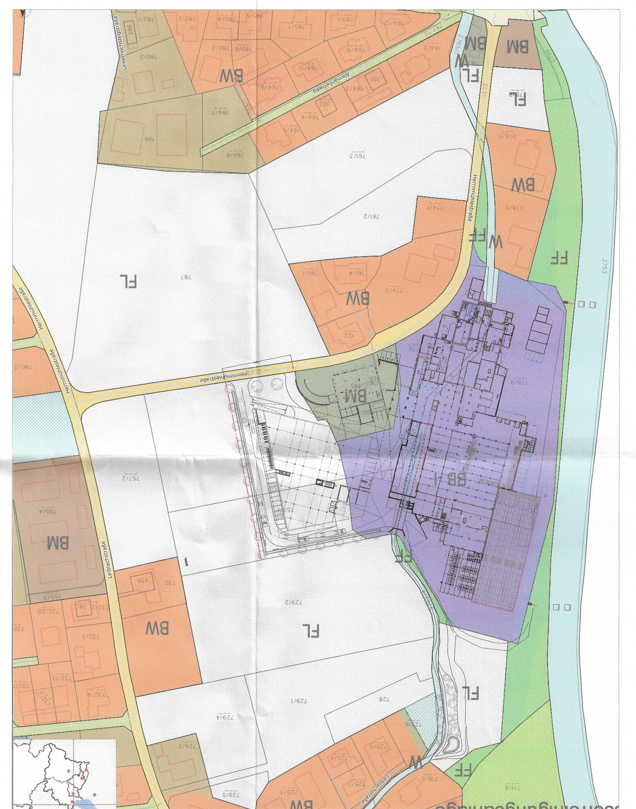
VOGIS Flächenwidmung M 1/1250