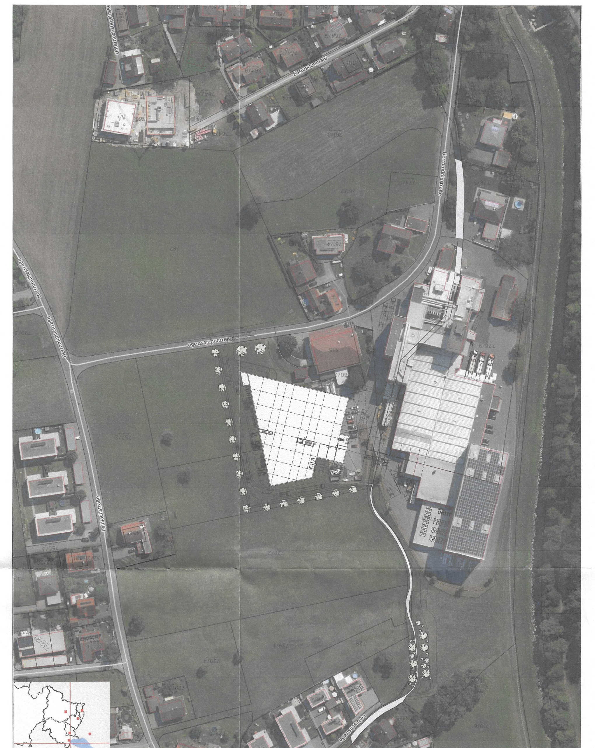
VOGIS Übersicht M 1/1250