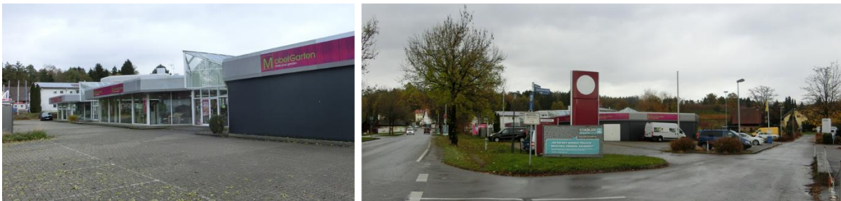
Abbildung 2: Vorhabenstandort