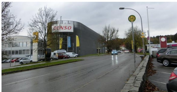
Abbildung 4: Nutzungen im unmittelbaren Standortumfeld