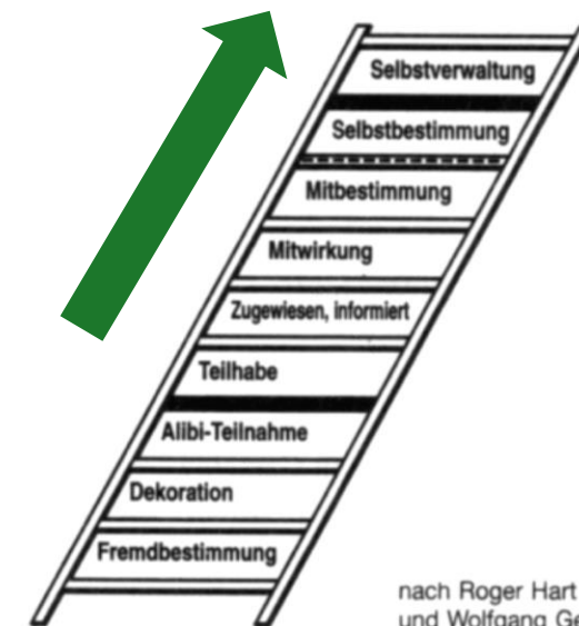
Stufen der Beteiligung

nach Roger Hart (1992) und Wolfgang Gernert (1993)