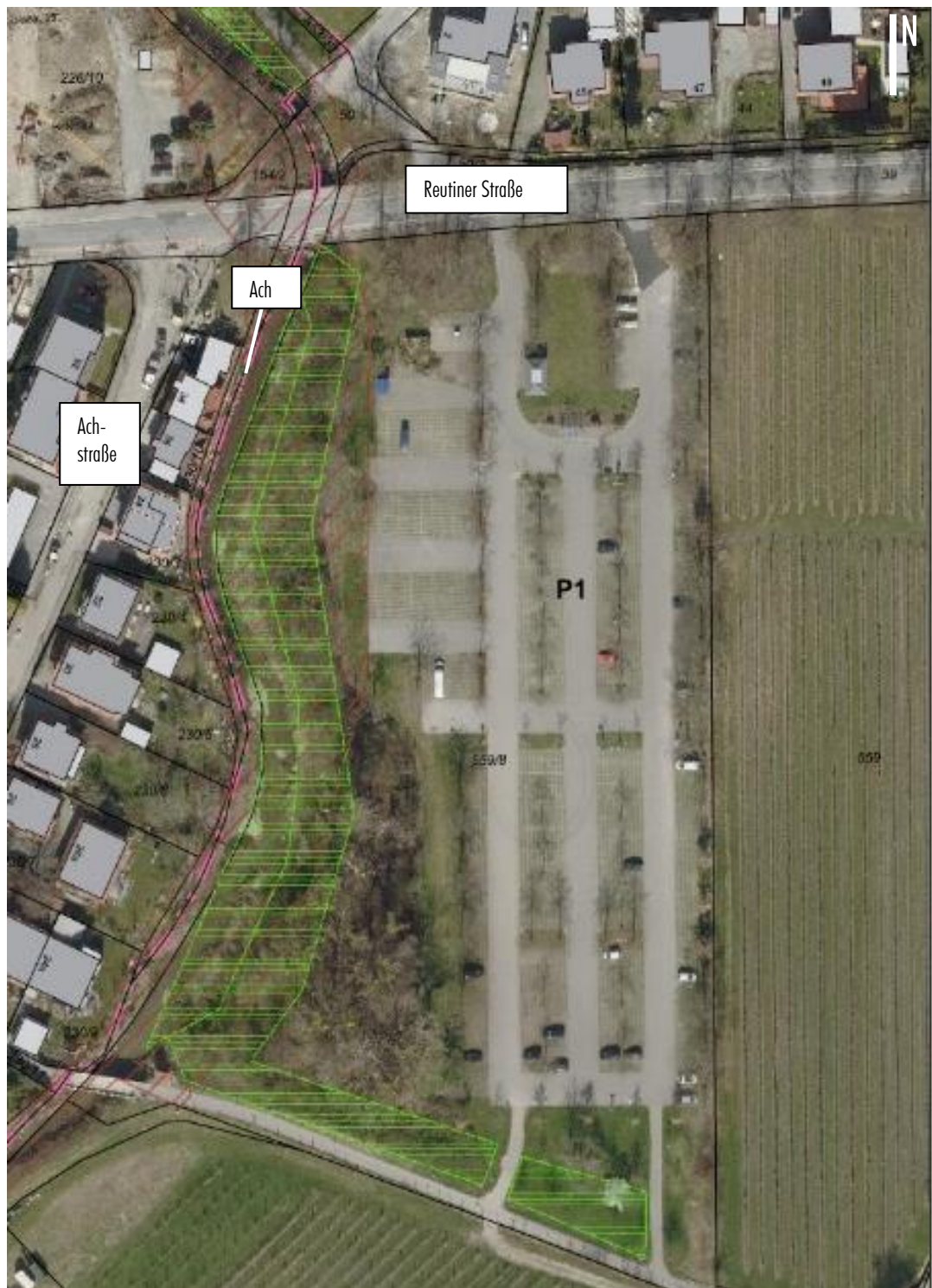
Übersichtsluftbild des Parkplatzes (P1), FFH-Gebiet (braune Schraffur), Ausgleichsflächen (grüne Schraffur), maßstabslos, Quelle Luftbild: Stadt Lindau (B)