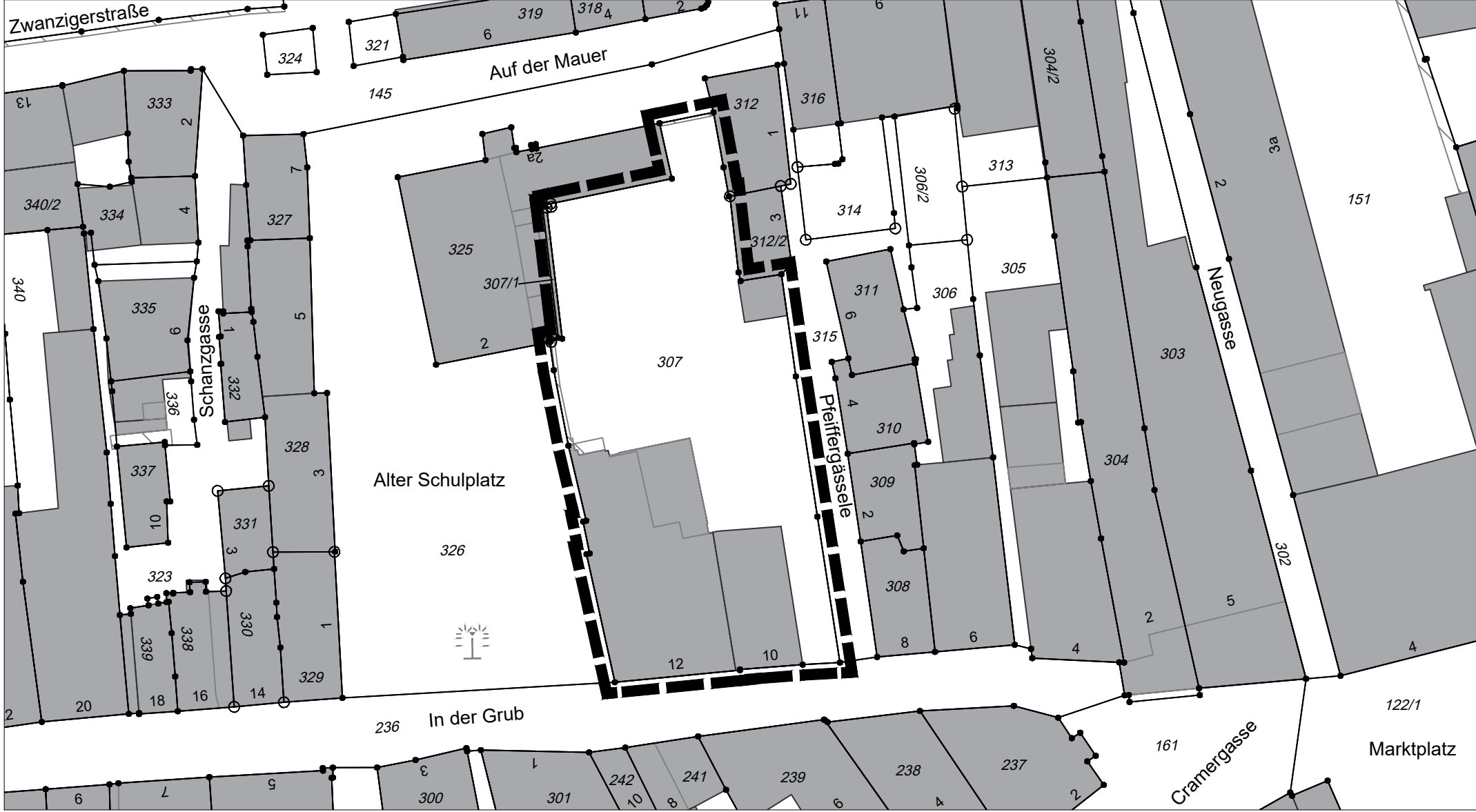
Bebauungsplan Nr. 86 "Altstadt", 12. Änderung "In der Grub 10 und 12", Lageplan zur Aufhebung der Veränderungssperre Stadtbauamt Lindau Abt. Stadtplanung, Umwelt und Vermessung 31.01.2024