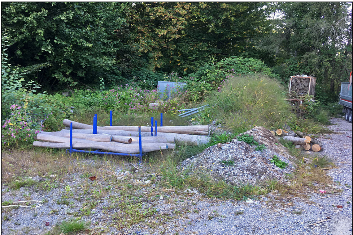
Abb. 2, Abb. 3: Lagerflächen im Randbereich des Stadtgärtnerei-Geländes, strukturell für die Zauneid- echse grundsätzlich geeignet. Bilder 15.9.2020