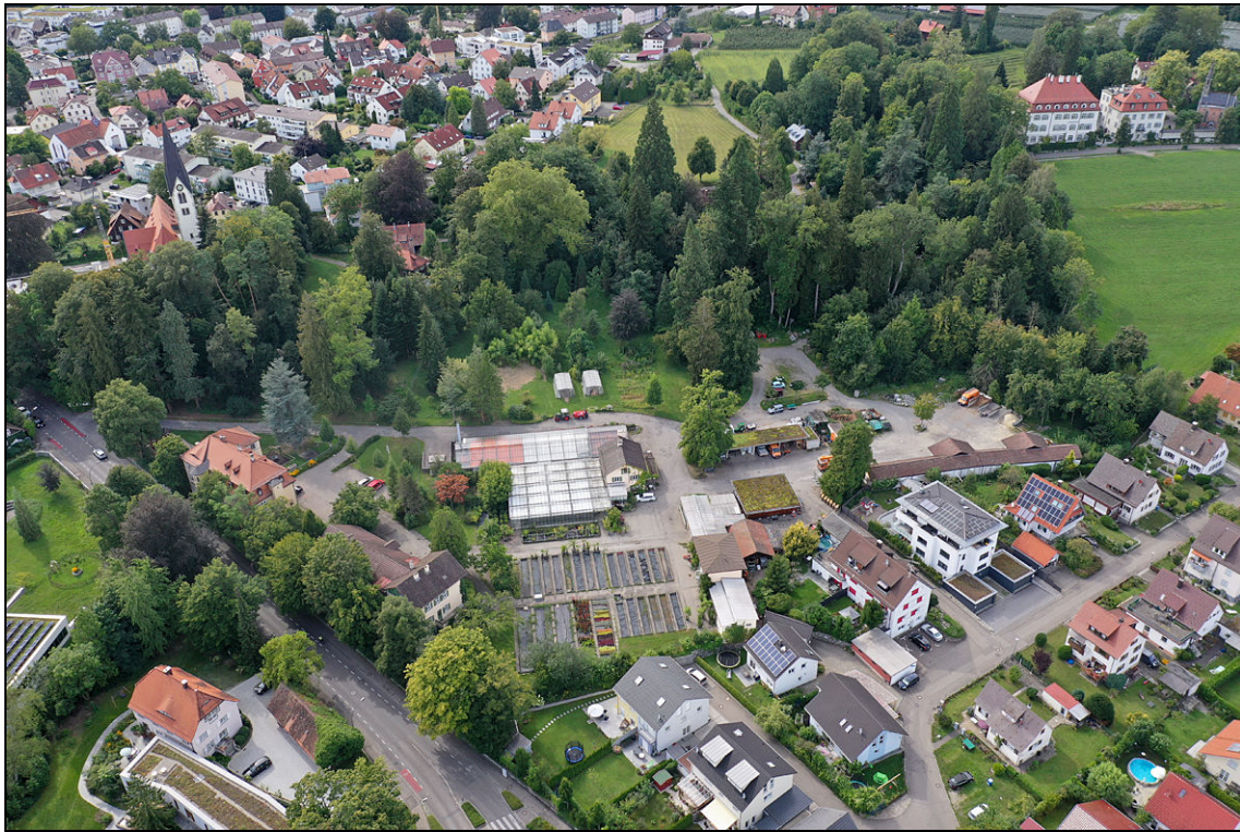
Abb. 1: Blick auf das Gelände etwa von Osten. 24.8.2020