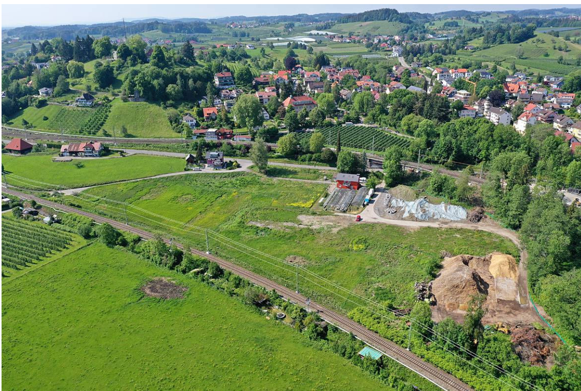
Abbildung 4: Blick über das Gelände von Südosten am 16.5.2020.