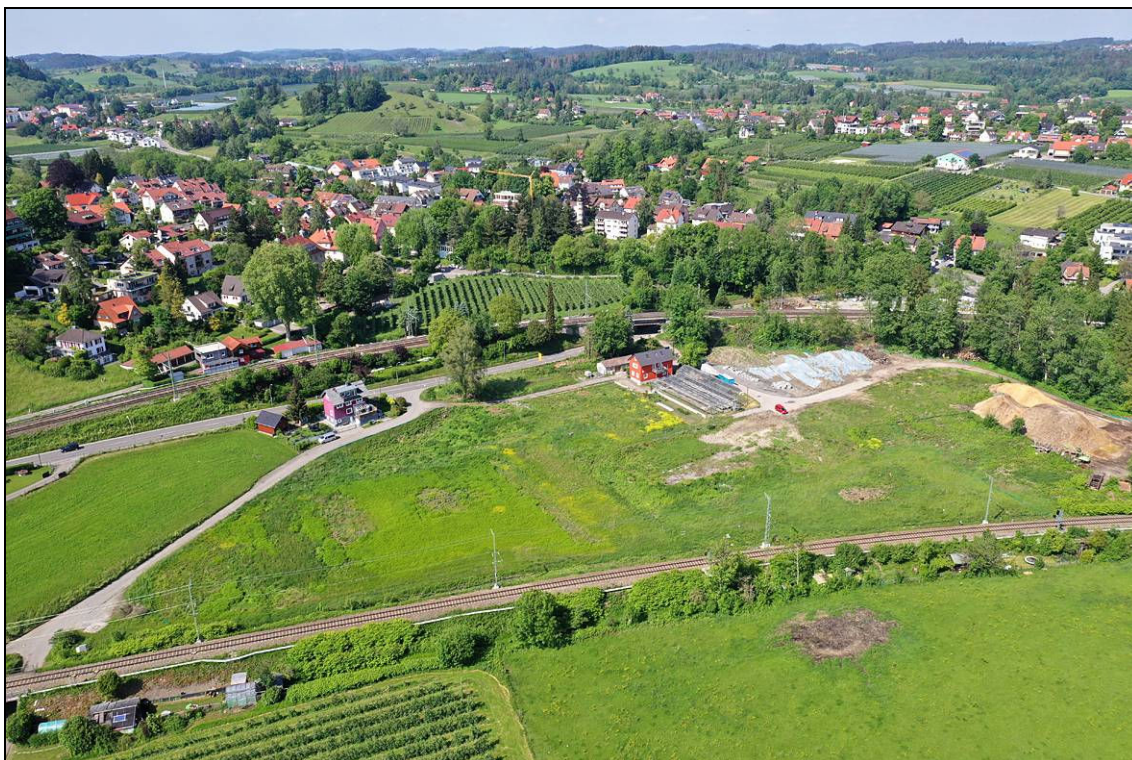
Abbildung 5: Ansicht von Südwesten am 16.5.2020.