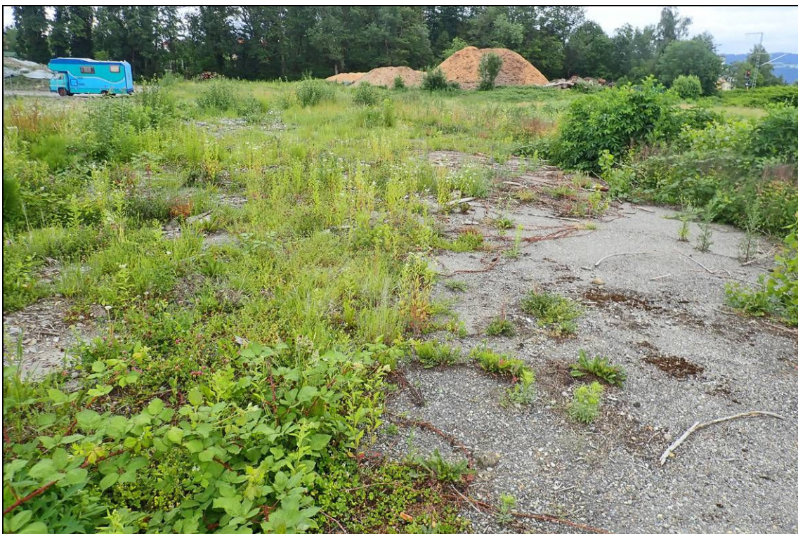
Abbildung 8: Die offenen, vegetationsarmen Bereiche südlich der Gewächshäuser sind teils asphaltiert, teils stark verdichtet und nicht grabbar, deshalb für Zauneidechsen nicht für die Eiablage nutzbar. 8.6.2020.