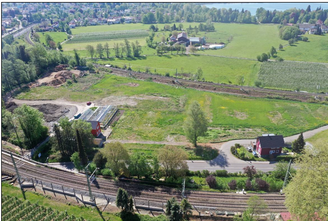
Abbildung 3: Blick über das Gelände von Norden am 27.4.2020.