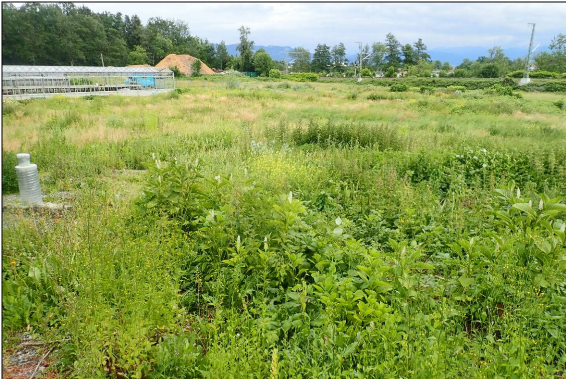
Abbildung 7: Blick über das Gebiet von Nordwesten; erkennbar ist die dichte, hochwüchsige, zum Teil stark eutrophierte Vegetation. 8.6.2020.