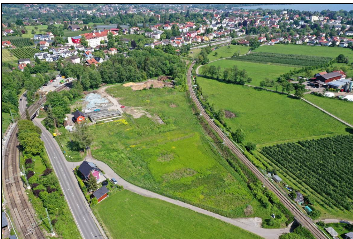
Abbildung 6: Ansicht von Westen am 16.5.2020.