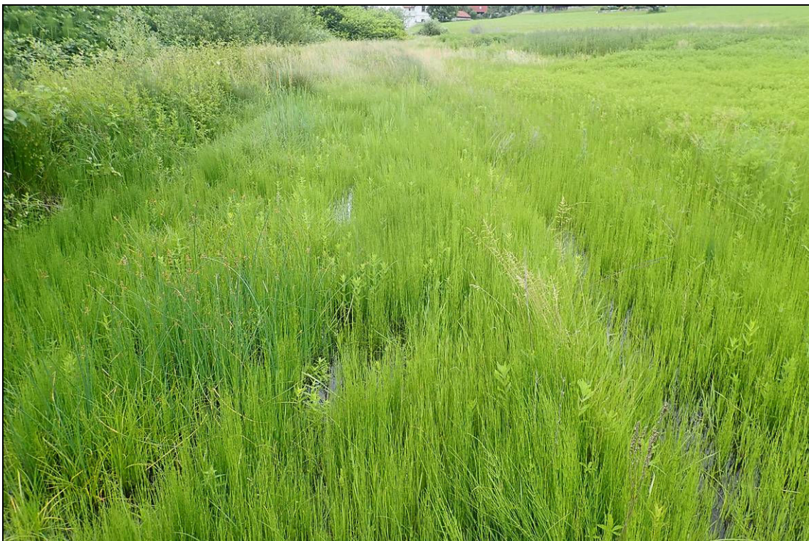
Abbildung 10: Am Böschungsfuß der Bahnlinie, die das Areal nach Süden begrenzt, liegen die nassesten Flächen des ehemaligen Gärtneriegeländes, hier mit Rohrkolben, Teichbinse und viel Sumpf-Schachtelhalm. 8.6.2020.