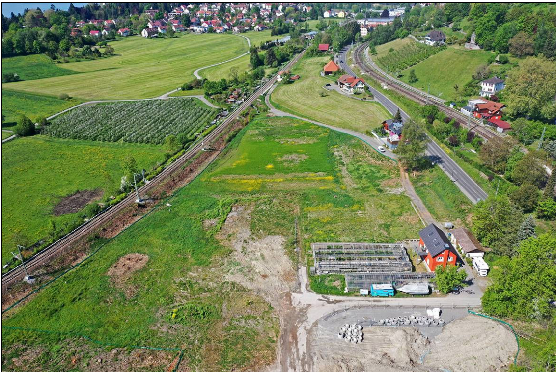
Abbildung 1: Blick über das "Priel-Areal" von Osten am 27.4.2020.

Das Gelände der ehemaligen Gärtnerei Kunzendorf in Lindau ("Priel-Areal"), das nach dem Abriss des größten Teils der Gewächshäuser brach liegt, soll bebaut werden.