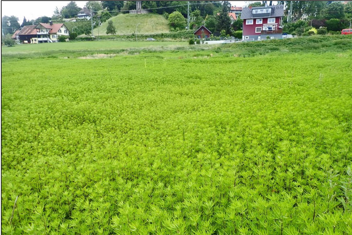
Abbildung 9: Auf großen Teilen der ehemaligen Freiland-Anbauflächen hat sich inzwischen der Gewöhnliche Beifuß ( Artemisia vulgaris ) ausgebreitet und bildet hier fast reine Bestände. 8.6.2020.