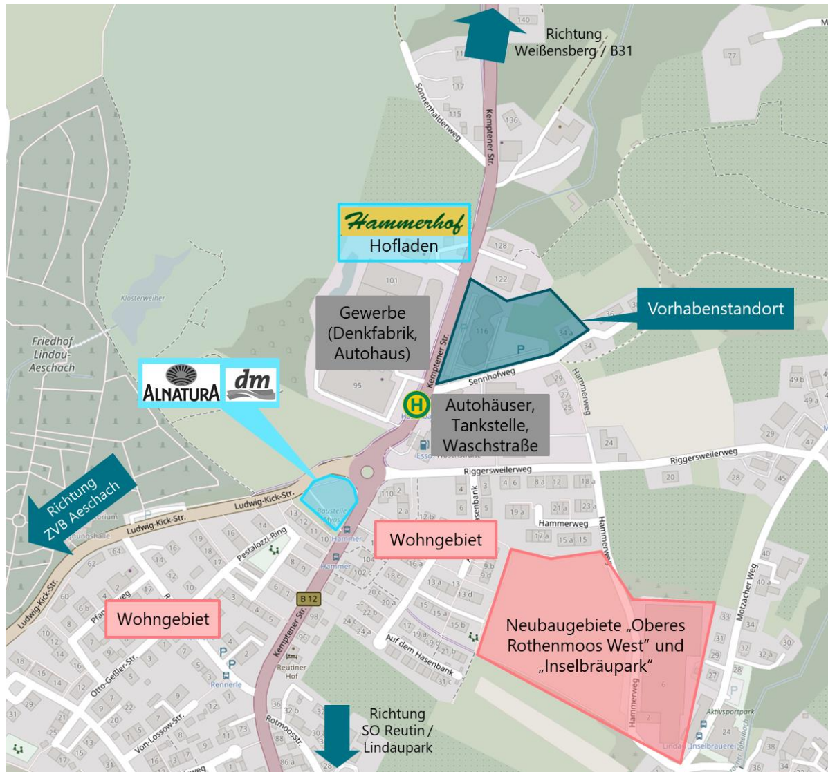
Abbildung 3: Mikrostandort Kemptener Straße 116 in Lindau

Kartengrundlage: © OpenStreetMap 2022; Bearbeitung: CIMA Beratung + Management GmbH, 2022; schematische Darstellung. Die Anbieter Alnatura und dm sind aufgrund ihrer noch ausstehenden Realisierung mit grauen Symbolen dargestellt.