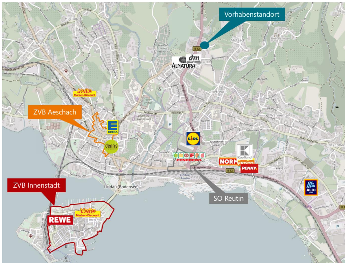
Abbildung 5: Strukturprägende Lebensmittelanbieter in Lindau

Kartengrundlage: © OpenStreetMap 2022; Bearbeitung: CIMA Beratung + Management GmbH, 2022