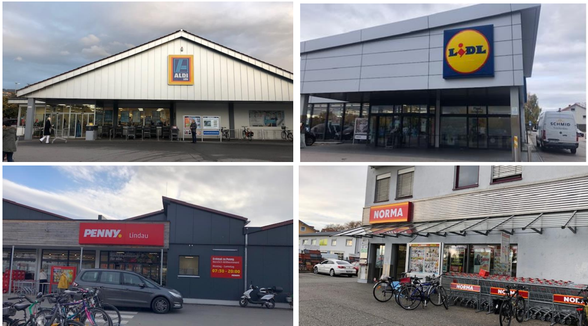
Abbildung 6: Lebensmittelangebot in den sonstigen Lagen