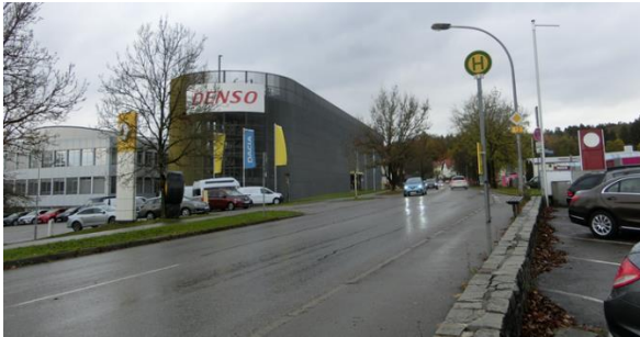
Abbildung 4: Nutzungen im unmittelbaren Standortumfeld