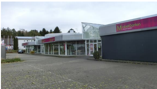
Abbildung 2: Vorhabenstandort

Auf dem Vorhabenstandort befindet sich derzeit noch ein Fachmarkt für Gartenmöbel. Dieses Bestandsgebäude soll im Zuge der Umsetzung des Planvorhabens abgerissen und durch einen Neubau ersetzt werden.