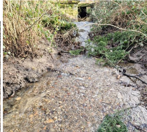
Abbildung 4: Ansicht des Boden-Aufbaus aus Humus und Gestein (4.1) sowie der Gewässersohle im Unterlauf (4.2).

In Abstimmung mit der UNB Lindau wurden alle Bäume markiert, die artenschutzfachlich nicht relevant sind und deren Fällung keine Verbotstatbestände auslöst. Mit der Ausführung wurde Florian Mrowka (Forstwirtschaftliche Dienstleistungen, Lindau) beauftragt, der die Fällungen innerhalb des gesetzlich vorgeschriebenen Zeitraumes (01.10. bis 28.02.) durchführte – bis 13.02.2024 wurden alle markierten/freigegebenen Bäume gefällt und abtransportiert.