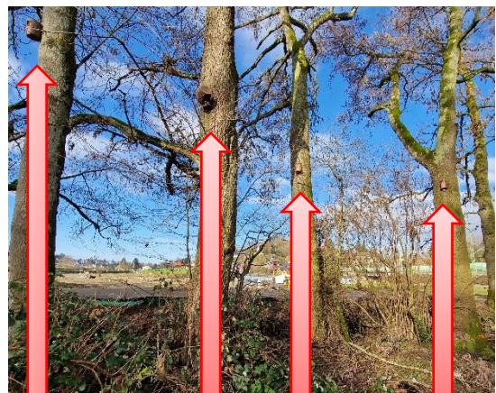
Abbildung 5: Ansicht auf die erhaltenen Bäume mit Fledermausnistkästen (rote Markierungen) östlich des Giebelbach-Bestands.

Da sich der Bestand überwiegend aus Fichten, Grau- und Schwarzerlen jungen bis mittleren Alters zusammensetzt, ist das Angebot an Höhlen und Spalten der Bäume eher gering. Dennoch muss mit Fledermausquartieren entlang des Gewässers gerechnet werden.