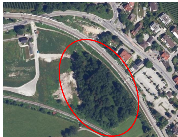
Abbildung 1: Plangebiet im DOP (roter Umgriff).

Nördlich und Östlich verläuft die Bahntrasse, dahinter befindet sich dichte Bebauung. Im Westen liegt das brache Lehrgut Priel, das im Zuge der Planungen bebaut werden soll. Im Süden verläuft ebenfalls eine Bahntrasse, dahinter liegen offene Landwirtschaftsflächen mit einigen Feldgehölzen als Strukturelemente.