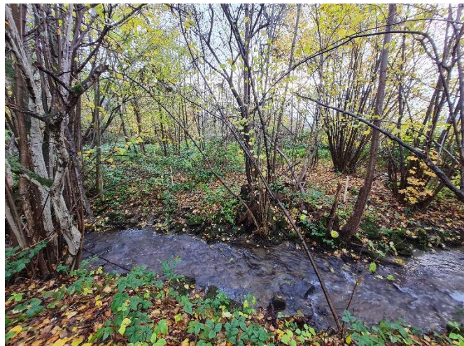
Abbildung 3: Ansicht des Giebelbach und den Baum-Bestand.

Im Oberlauf, bei Eintritt des Gerinnes aus der Verrohrung im Norden der Fl.-Nr. 482 befindet sich ein Wehr, das durch die Verlegung dennoch erhalten bleibt.