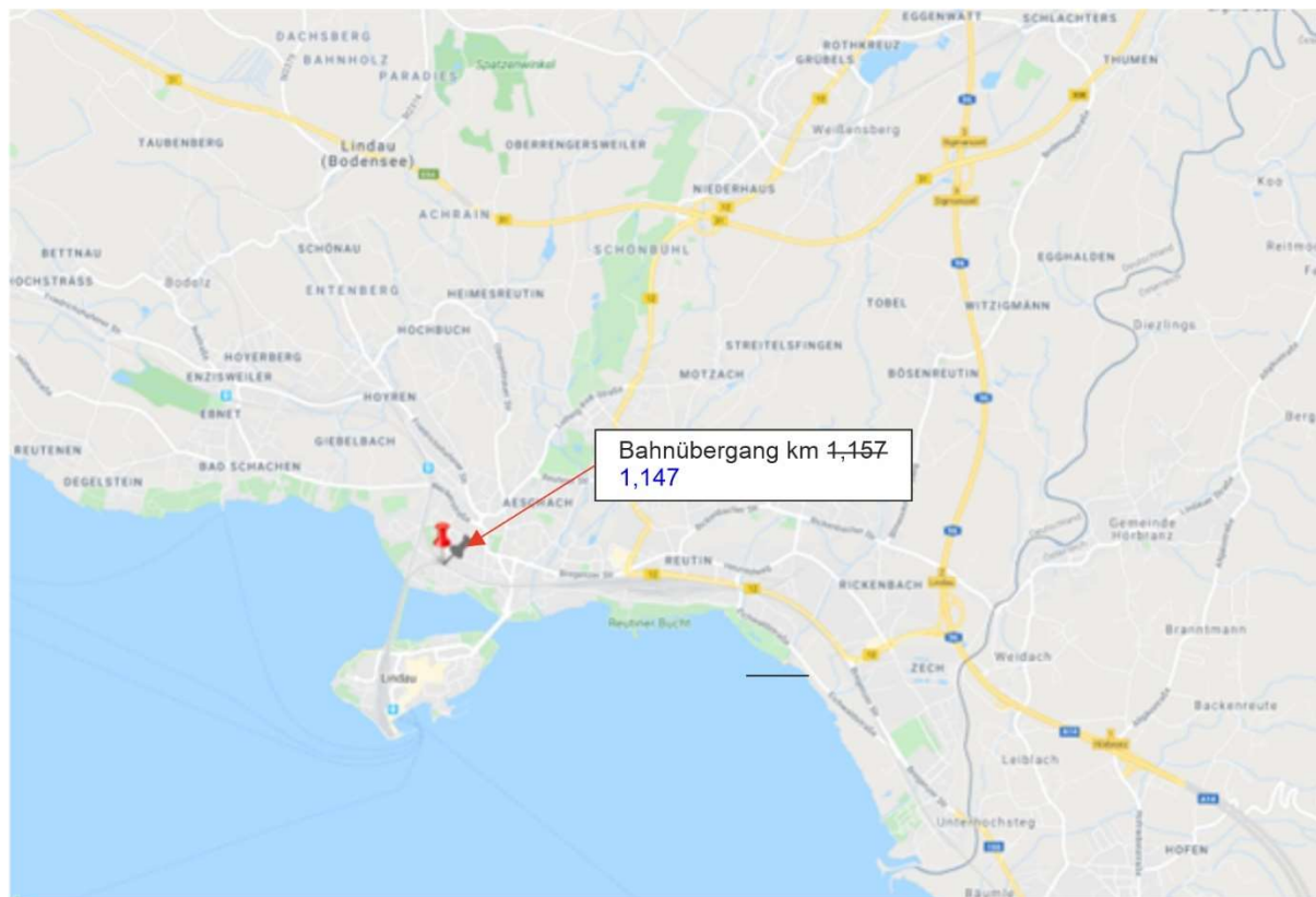
Abbildung 1: Lage des Bauwerks

Maßnahme G: Beseitigung des Bahnübergangs Hasenweidweg Ost