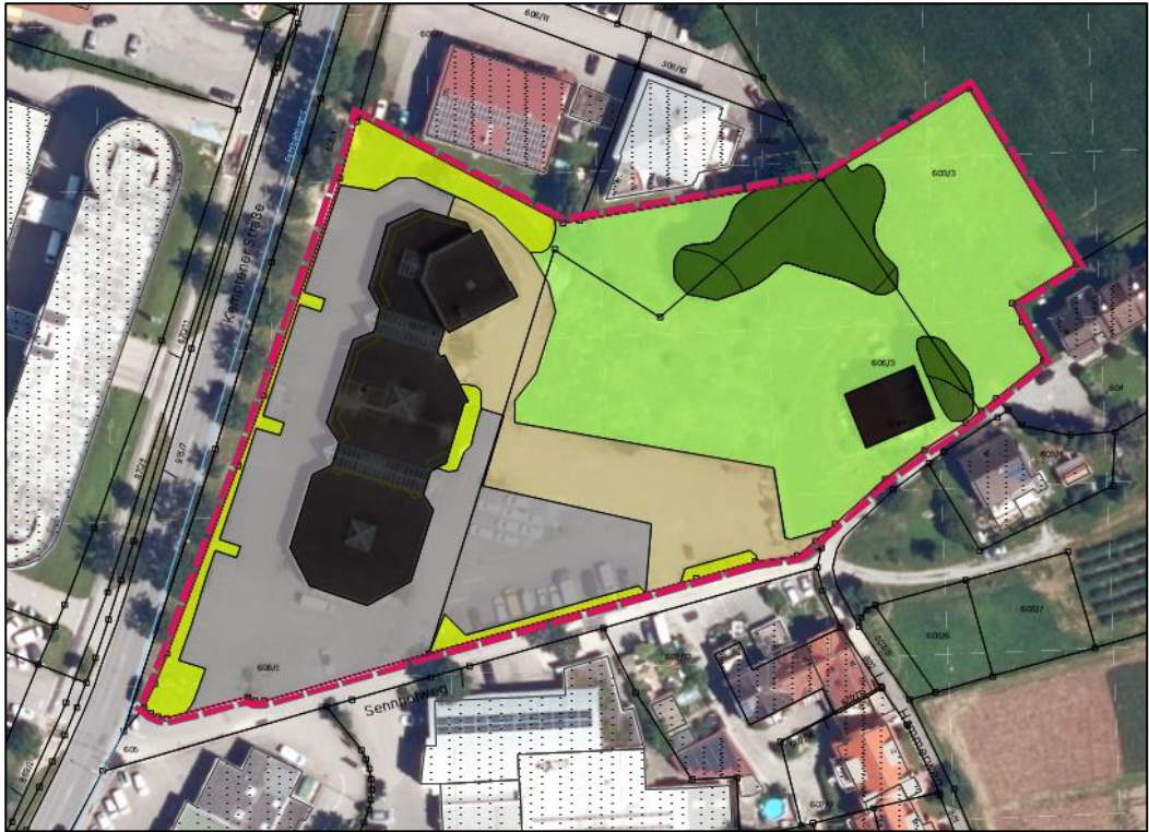
Abbildung 1: Bestandserfassung der im Gebiet vorkommenden Biotop- und Nutzungstypen.

* Im vorhabenbezogenen Bebauungsplan als Grünfläche (Wertigkeit 3 WP) festgesetzt.