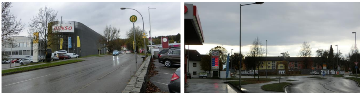
Abbildung 4: Nutzungen im unmittelbaren Standortumfeld