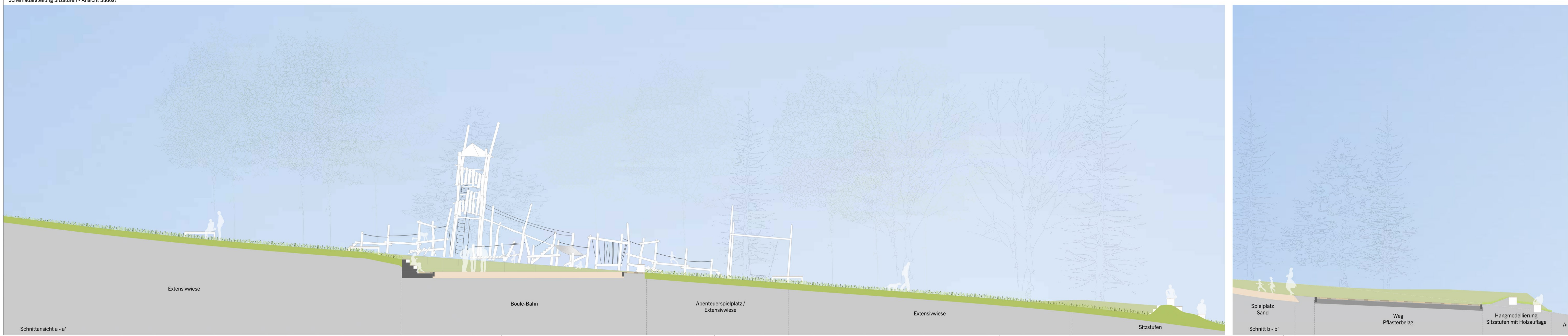
Schemadarstellung Sitzstufen - Ansicht Südost