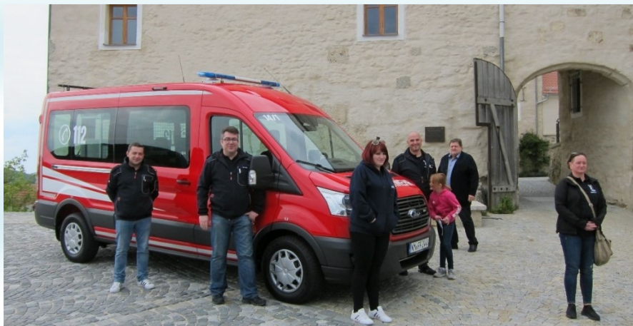
Der neue Mannschaftstransportwagen der Feuerwehr Ferienprogramm

Aufgrund der aktuellen gesetzlichen Vorgaben plant die Gemeinde das Programm für die Sommerferien etwas reduziert als „Notprogramm“, bei dem ein Großteil der Veranstaltungen im Freien stattfindet. Die Ferienpassfahrten des Kreisjugendrings sowie der Familientag der Marktgemeinde müssen wegen der Corona-Vorschriften leider ganz entfallen .