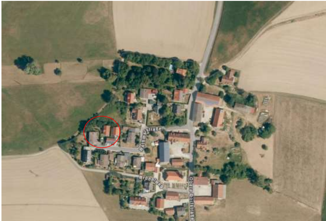
Abb. Darstellung der Nutzung der Flächen Kartengrundlage Geobasisdaten Bay. Vermessungsverwaltung 2020