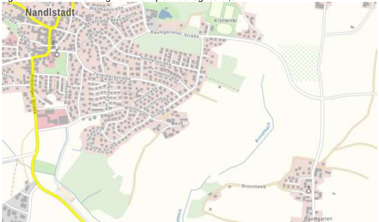
Abb. Örtlicher Straßenverkehr Markt Nandlstadt Kartengrundlage Geobasisdaten Bay. Vermessungsverwaltung 2020

Die innere Verkehrserschließung des Planungsbereiches ist durch die Rothmarstraße gesichert. Die Entfernung zum Marktplatz beträgt ca. 2,5 km.