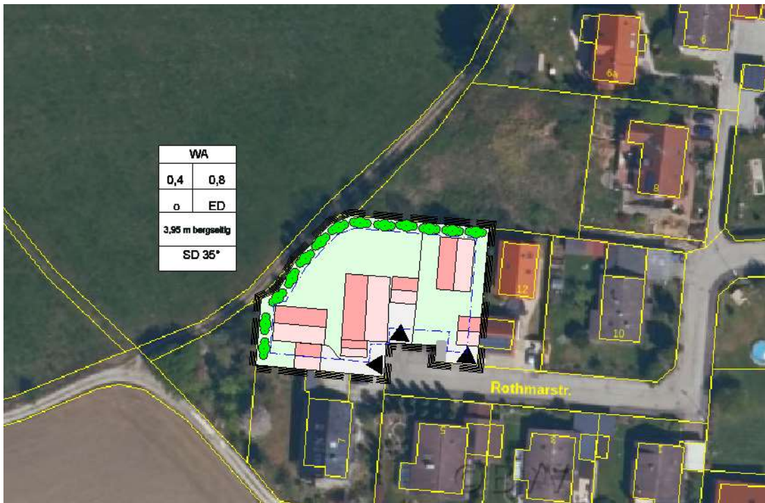
Abb. Räumlicher Geltungsbereich des Bebauungs- und Grünordnungsplanes „Baumgarten Nord-West 2. Änderung“ in Nandlstadt, Kartengrundlage Geobasisdaten Bay. Vermessungsverwaltung 2020