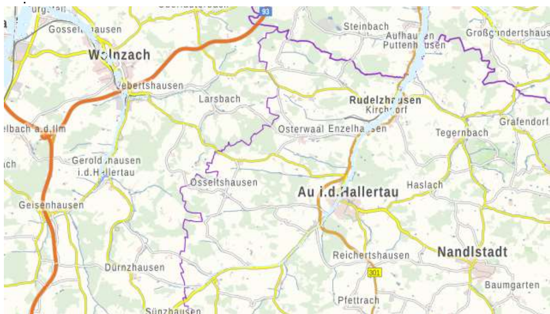
Abb. Überörtlicher Straßenverkehr Markt Nandlstadt

Im Norden verbindet die FS 32 den Markt Nandlstadt mit der ca. 6 km entfernten B301. Nächstgelegene Autobahn ist die A 93 mit der Anschlussstelle in Wolnzach