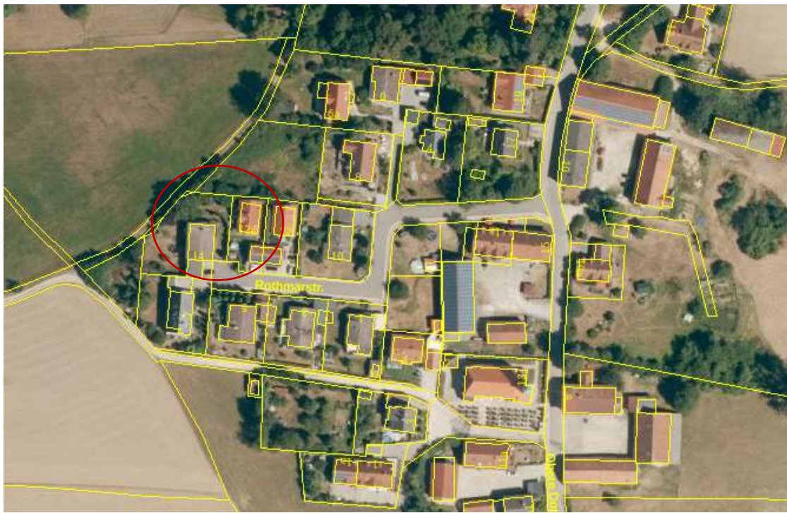
Abb. Lage des Geltungsbereiches des Bebauungs- und Grünordnungsplanes „Baumgarten Nord-West 2. Änderung“ im Raum (rot umrandet) Kartengrundlage Geobasisdaten Bay. Vermessungsverwaltung 2020