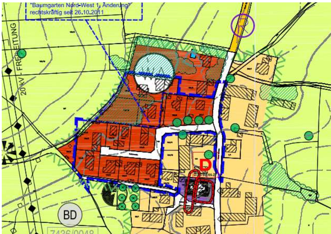
Abb. Ausschnitt aus dem rechtskräftigen Flächennutzungsplan