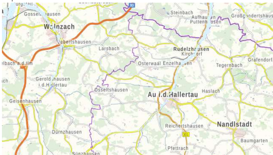
Abb. Überörtlicher Straßenverkehr Markt Nandlstadt Kartengrundlage Geobasisdaten Bay. Vermessungsverwaltung 2020

Im Norden verbindet die FS 32 den Markt Nandlstadt mit der ca. 6 km entfernten B301. Nächstgelegene Autobahn ist die A 93 mit der Anschlussstelle in Wolnzach