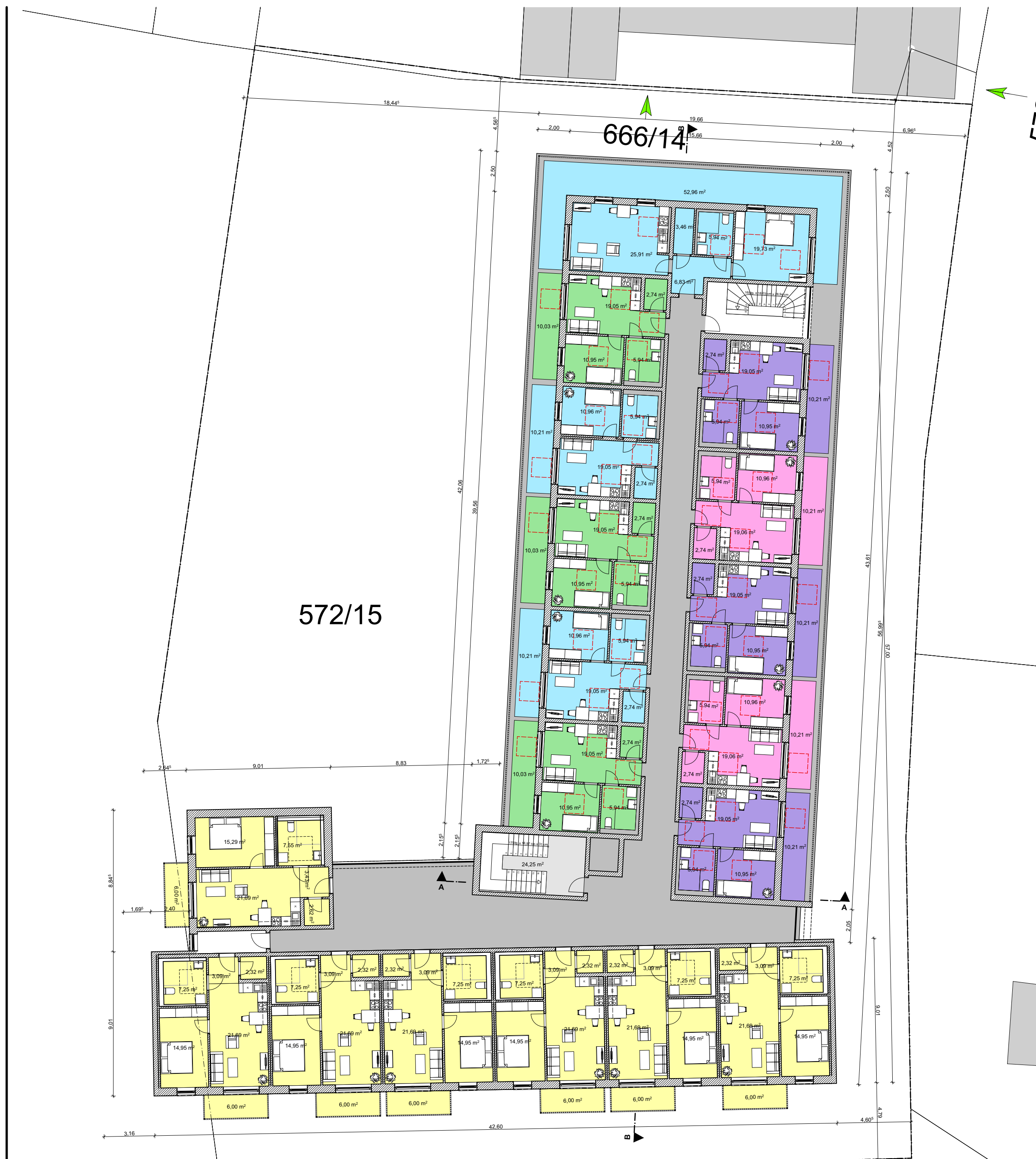
GRUNDRISS 3. OBERGESCHOSS