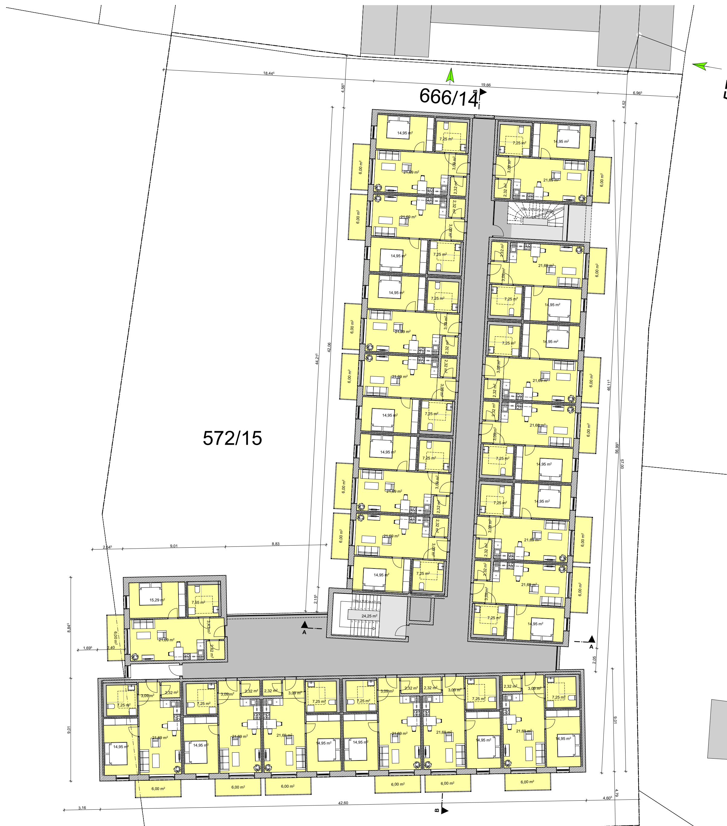
GRUNDRISS 2. OBERGESCHOSS