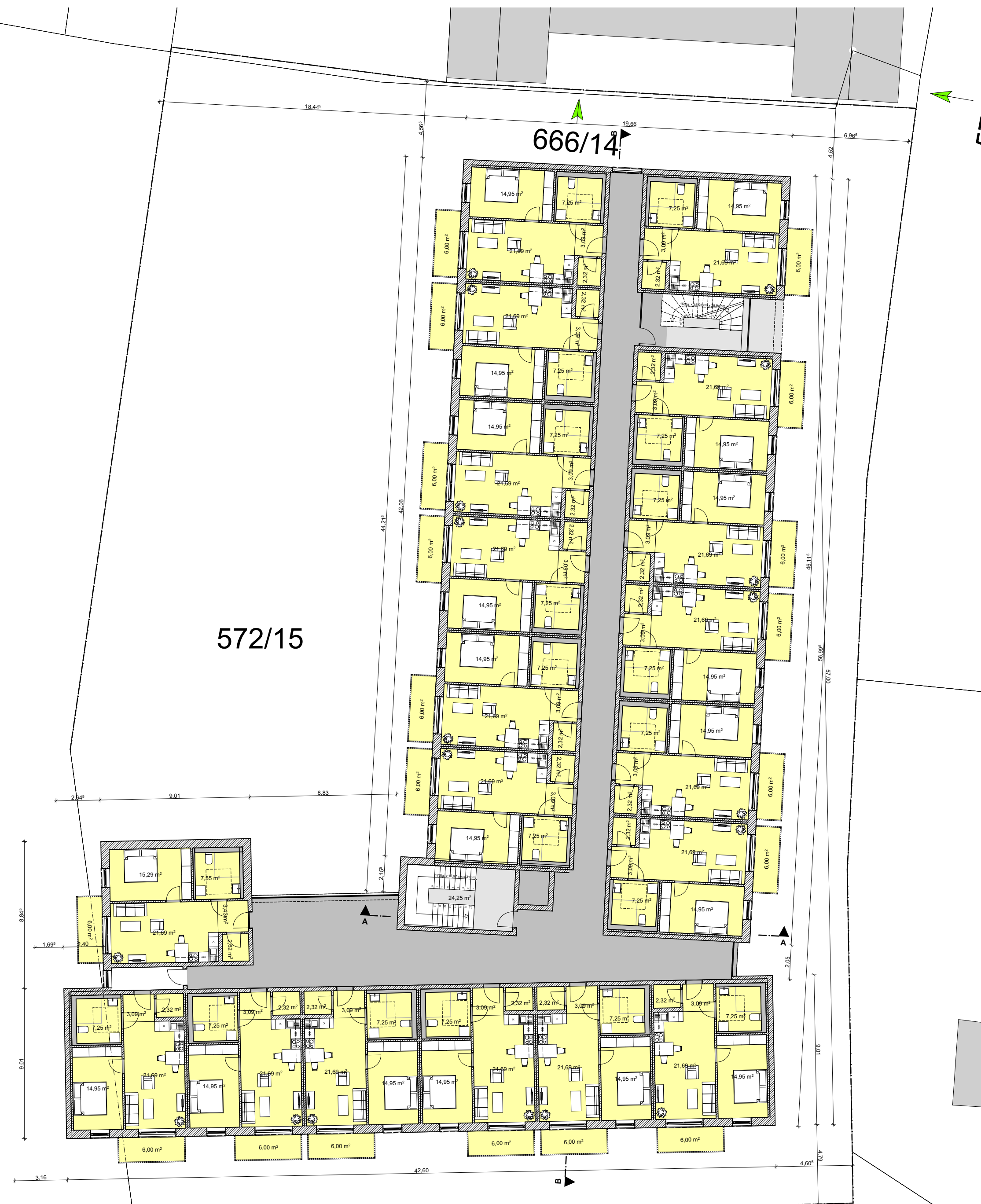
GRUNDRISS 2. OBERGESCHOSS