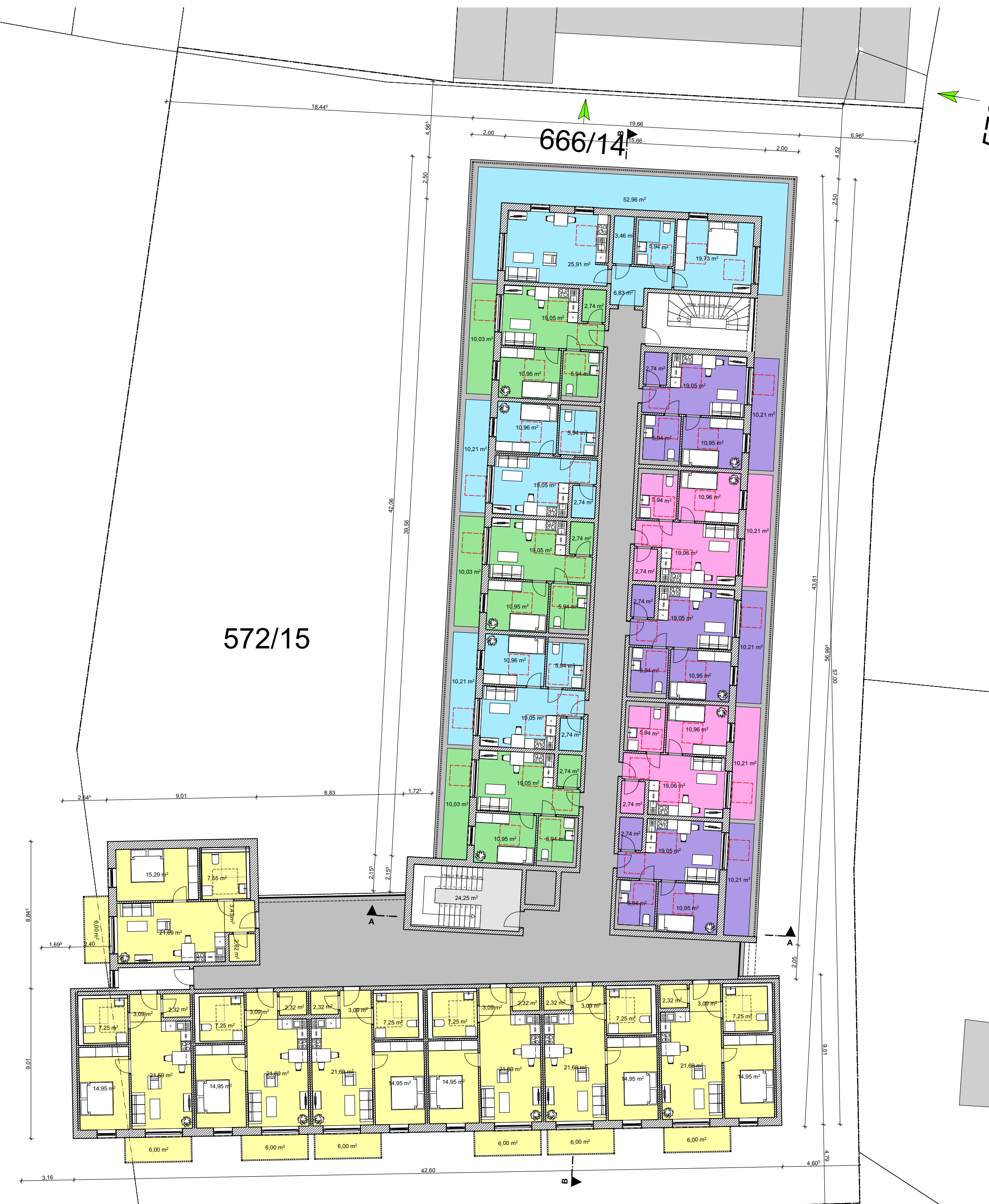
GRUNDRISS 3. OBERGESCHOSS