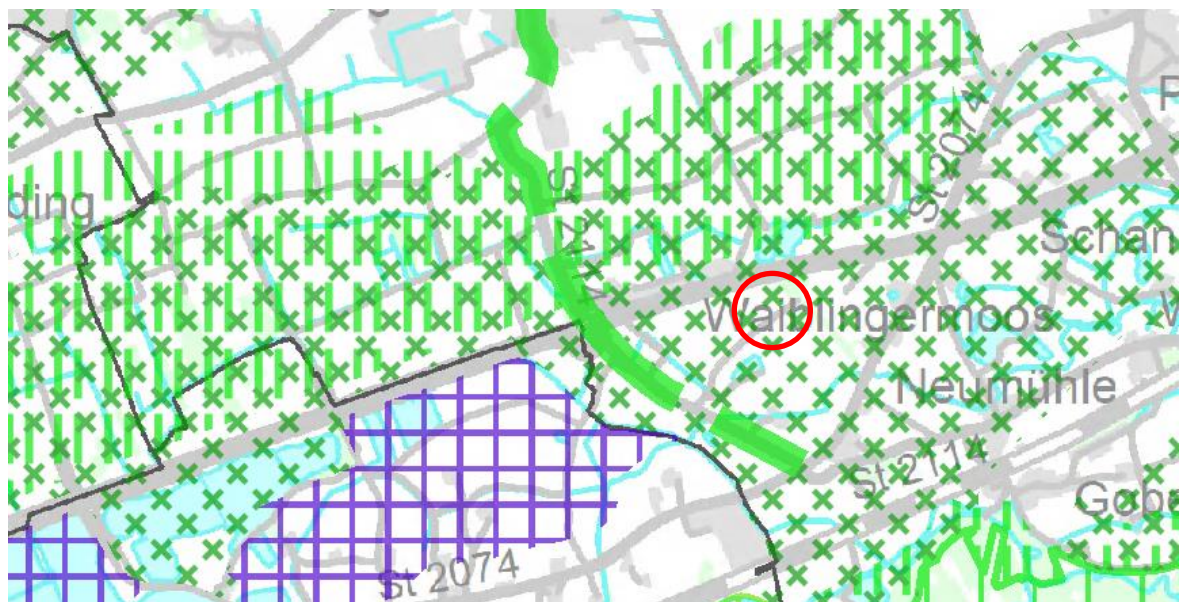
Auszug Ziele des Regionalplans Landshut (Region 13) (RISBY, 05/20)

Nach der Gliederung Bayerns in Verwaltungsregionen befindet sich der Markt Pilsting in der Region Landshut (Region 13) und ist als Kleinzentrum ausgewiesen. Auf Grund der günstigen Lage als Kreuzungspunkt der regionalen Entwicklungsachsen Landshut-Deggendorf und Landau-Straubing, sowie der vorhandenen und geplanten Infrastruktur kann die Marktgemeinde Pilsting die Funktion als Kleinzentrum gut erfüllen.