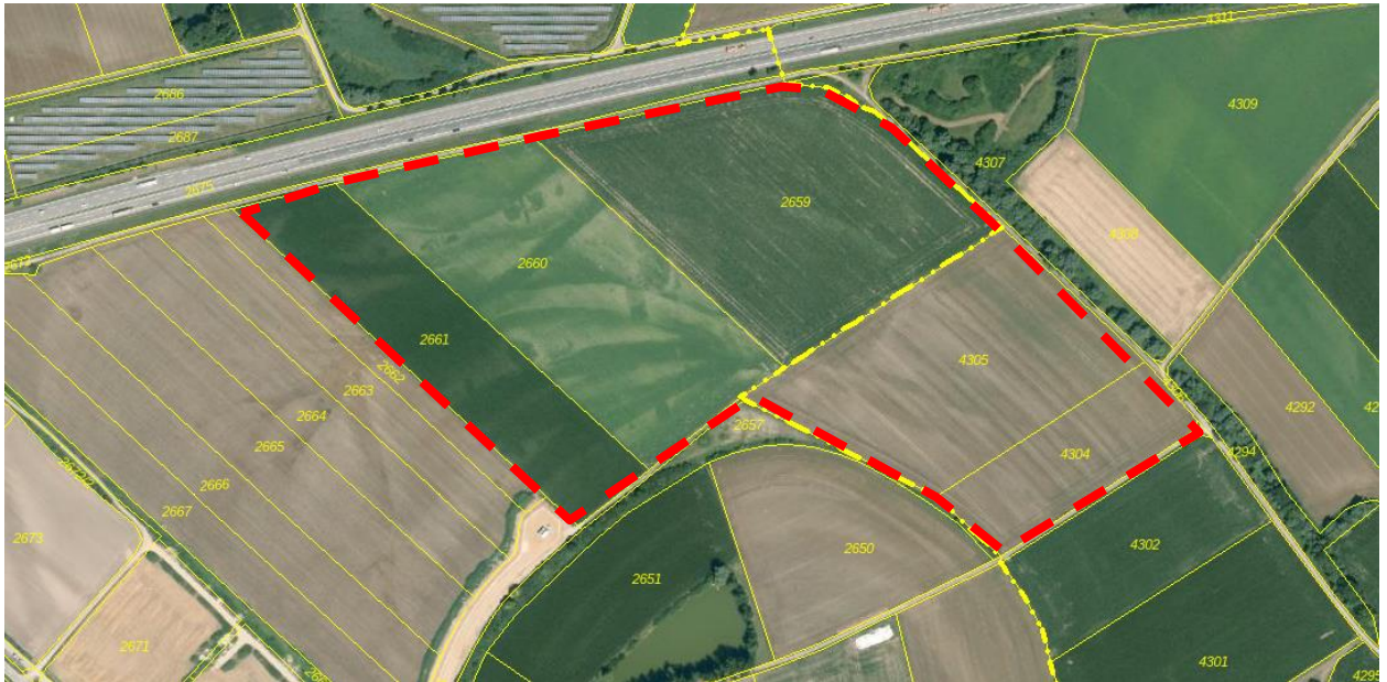
Lageplan Geltungsbereich Deckblatt Nr. 48 (nicht maßstäblich, BayernAtlas 04/20)

Die geplante Erweiterung des Industriegebietes (GI) wird auf derzeit landwirtschaftlich genutzten Ackerflächen realisiert.