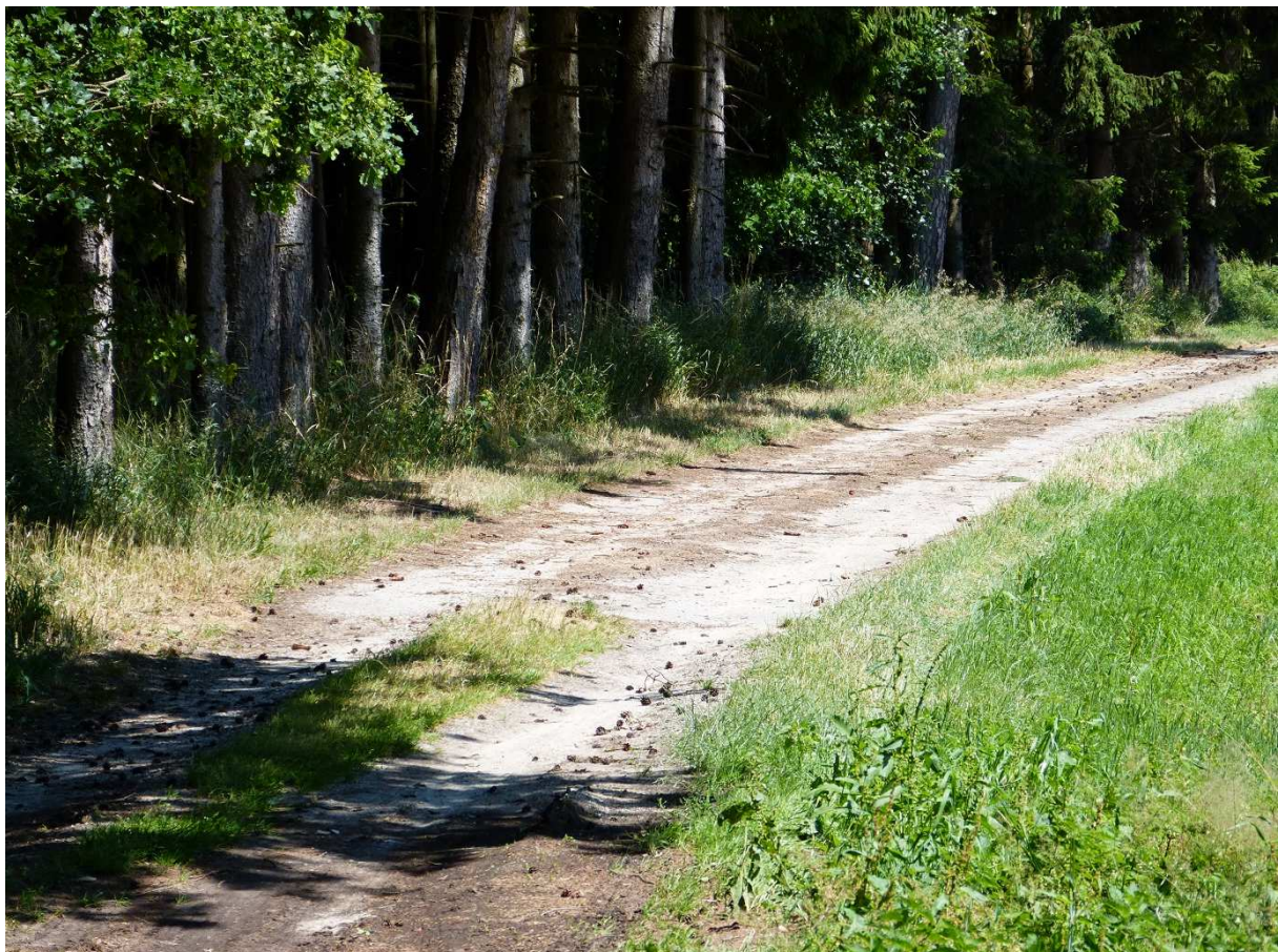
Abb. 4: Fundort eines Zauneidechsen-Männchens auf dem Feldweg westlich des Geltungsbereiches.

In jedem Fall finden die Tiere in der Umgebung des geplanten Eingriffs (v. a. Randstrukturen an der Autobahn A 9) weitere günstige Lebens- und Fortpflanzungsbedingungen. Eine Tötungs- oder Verletzungsgefährdung von einzelnen, wandernden Tieren im Geltungsbereich unterliegt dem allgemeinen Lebensrisiko und übersteigt somit nicht die Gefährdung im Rahmen der aktuellen Nutzung.