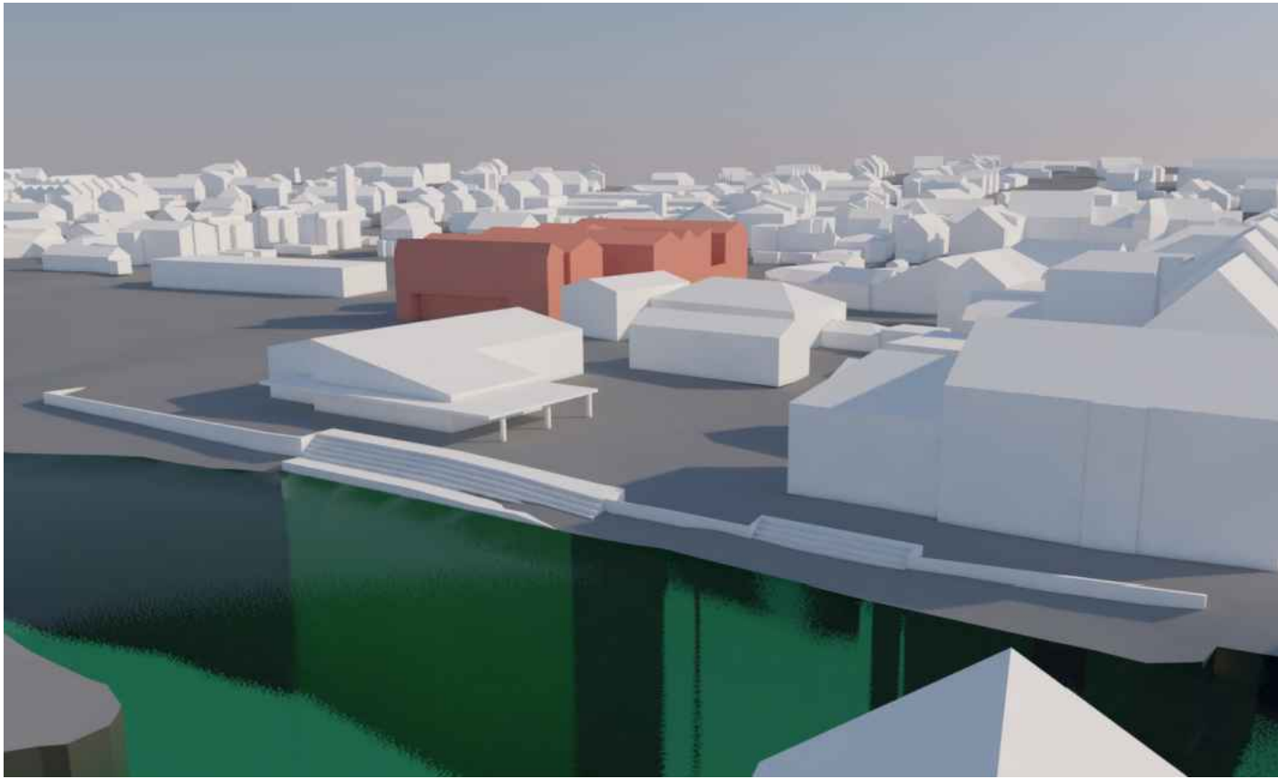
VARIANTE MIT 3 VOLLGESCHOSSEN