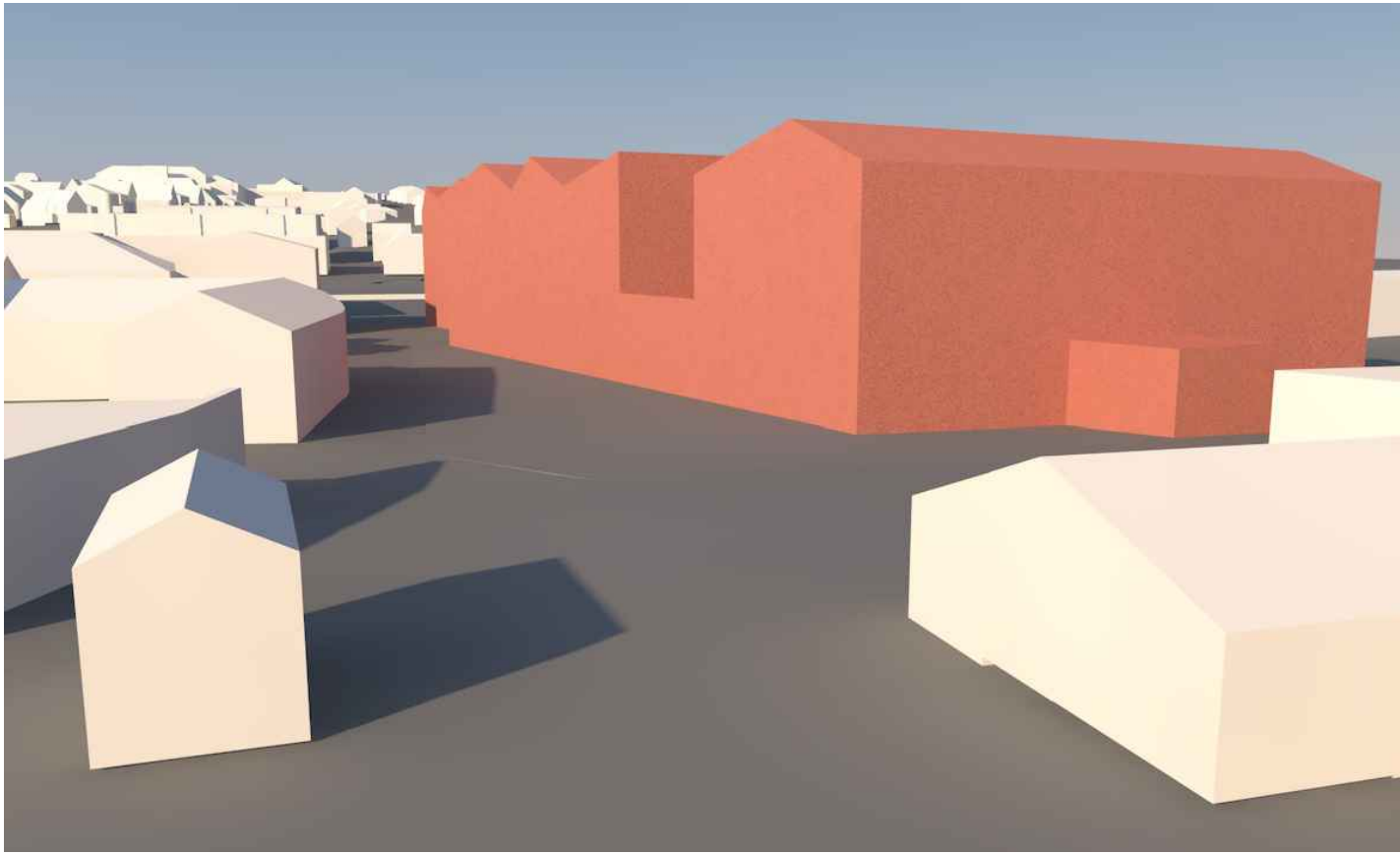
VARIANTE MIT 3 VOLLGESCHOSSEN