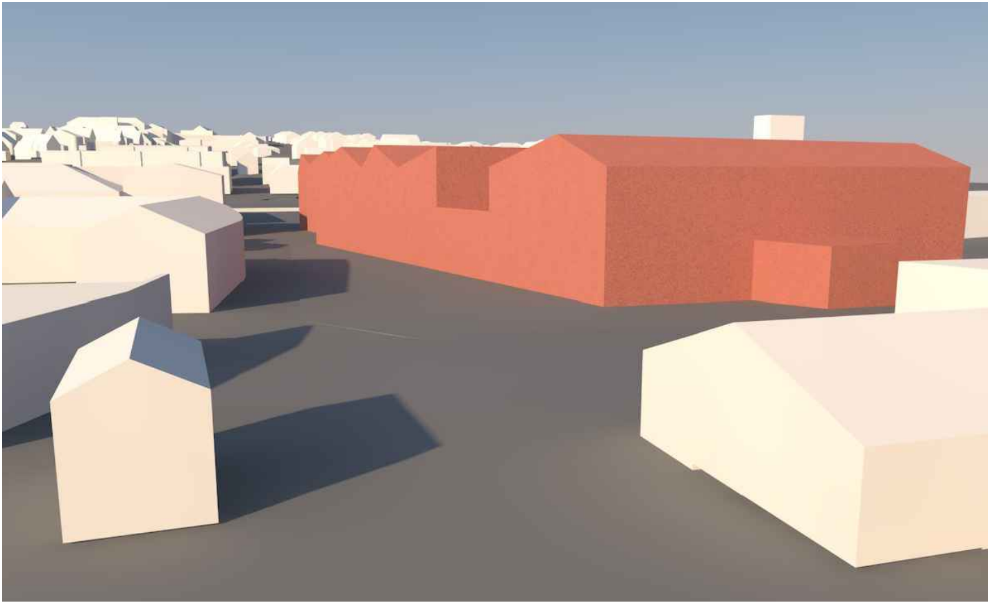
VARIANTE MIT 2 VOLLGESCHOSSEN