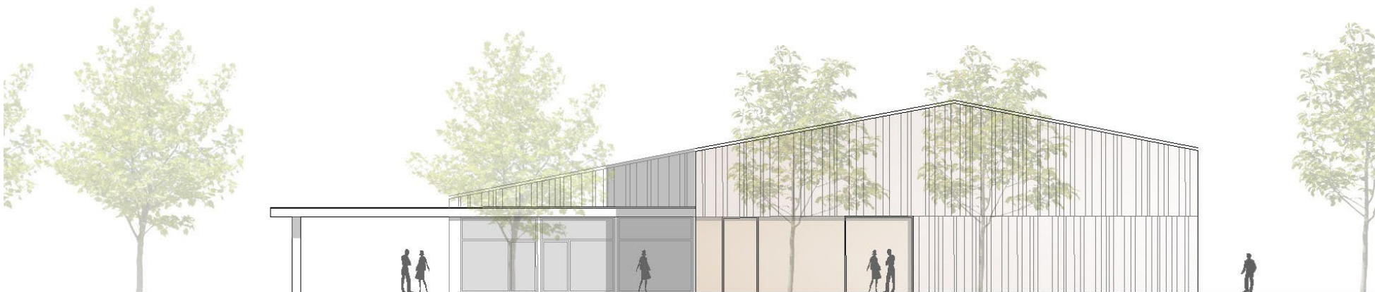
ANSICHT NORD-WEST (QUATIERSPLATZ)