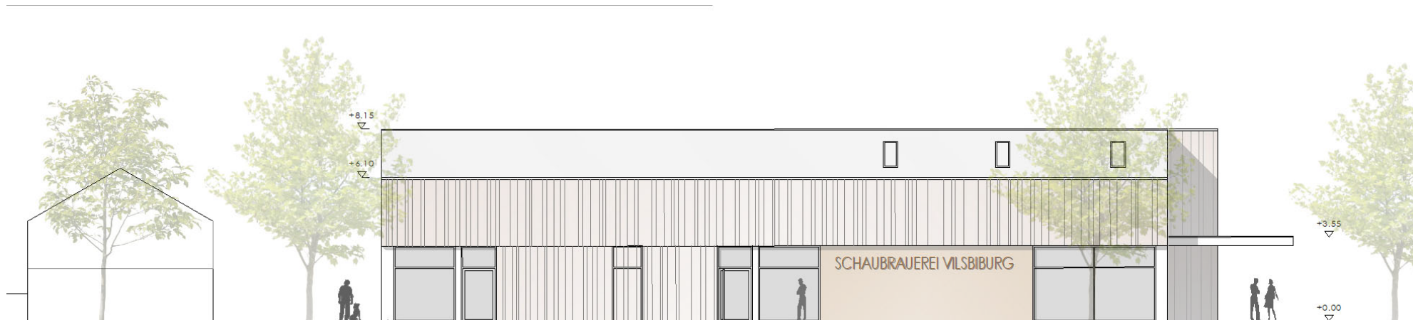
ANSICHT SÜD-WEST (FÄRBERANGER-PARKPLATZ)