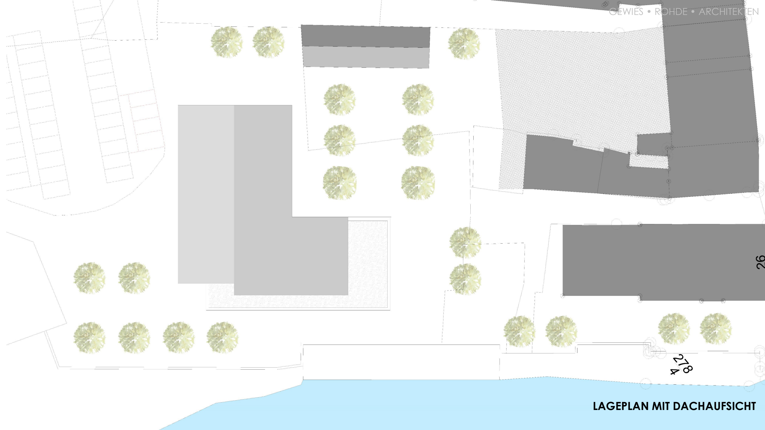
LAGEPLAN MIT DACHAUFSICHT