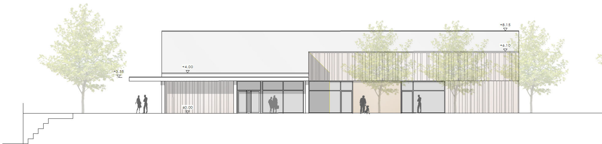
ANSICHT NORD-OST (QUATIERSPLATZ)