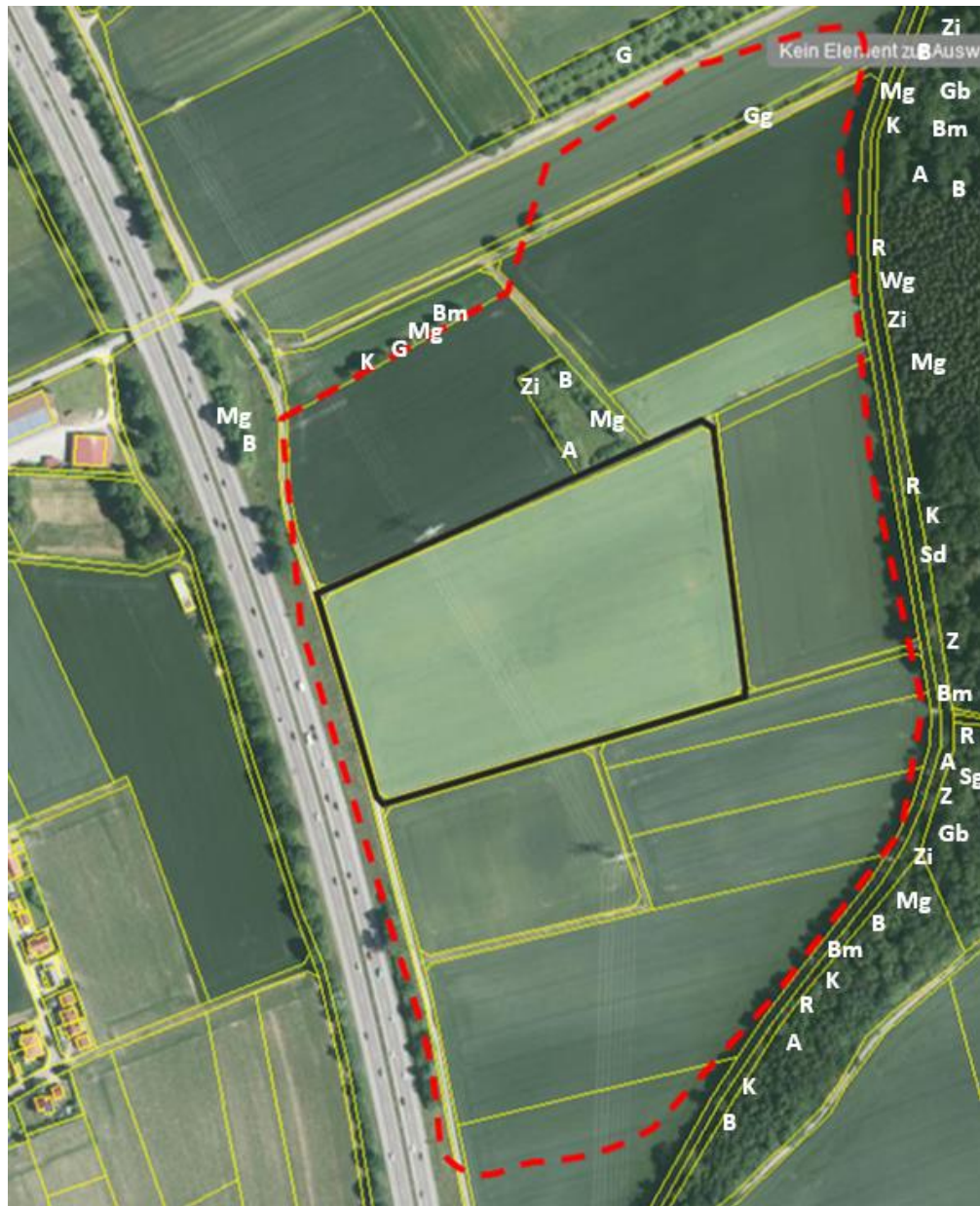
Abb.3: Brutvögel im Untersuchungsgebiet (Luftbild Quelle https://geoportal.bayern.de/bayernatlas/ ).