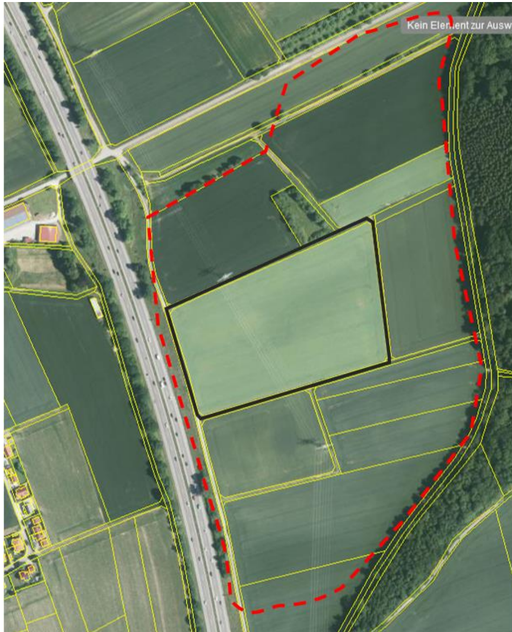
Abb. 1: Lage der Untersuchungsfläche (Schwarz=Untersuchungsfläche, Rot=Vorhabensfläche).

Der Betrachtungsraum der artenschutzrechtlichen Prüfung umfasst das Vorhabensgebiet und den daran angrenzenden Wirkraum von bis zu 150 m (Kulissenwirkung Feldlerche). Die Lage des Untersuchungsgebietes ist aus Abb. 1 ersichtlich.