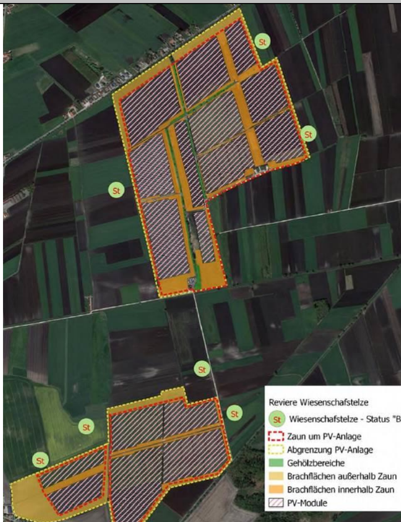
Abb. 4: Ergebnisse Kartierungen PV-Schornhof (LfU 2022)

Konfliktvermeidende Maßnahmen erforderlich: