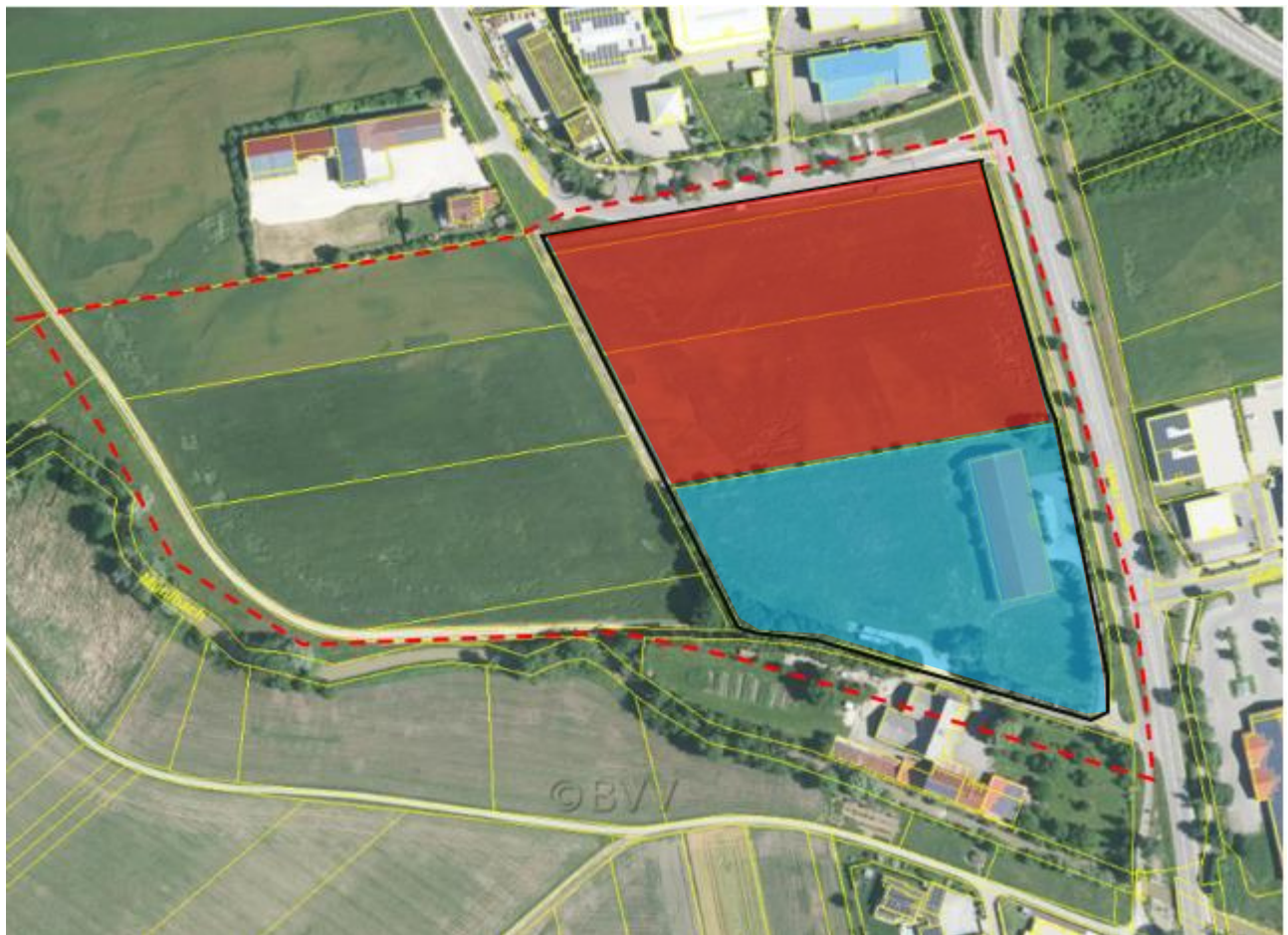
Abb.3: Unterteilung Bauvorhaben: Rot: Flurstücke 602 und 603, blau: Flst. 600

Für das Flurstück 600 sind kurzfristig keine Bauvorhaben vorgesehen. Das Gebäude und die Gehölze bleiben erhalten.