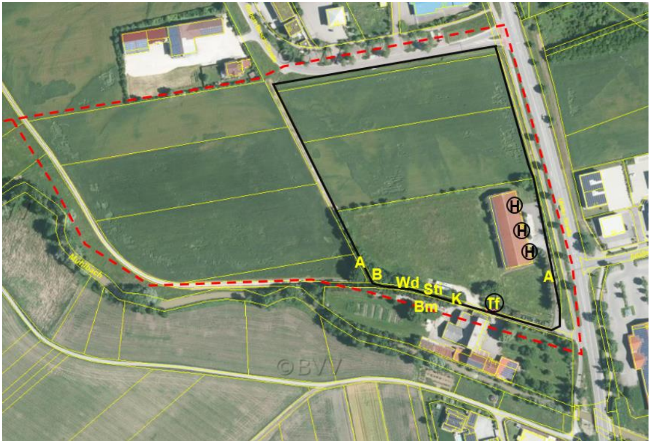
Abb. 6 Brutvögel des Untersuchungsgebietes (Kürzel s. Tabelle) Gelb: Gehölzbrüter, Schwarz: Gebäudebrüter, Kreis: Nestnachweis.