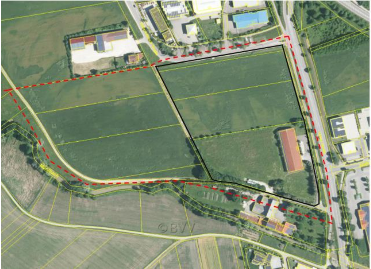
Abb. 1: Lage der Untersuchungsfläche (Rot=Untersuchungsfläche, Schwarz=Geltungsbereich (Luftbild aus https://geoportal.bayern.de/bayernatlas )

Um vorrangig den Bedarf einer gewerblichen Vergrößerung oder Neustrukturierung von Betrieben gerecht zu werden ist innerhalb des Plangebietes die Ausweisung einer großen zusammenhängenden Gewerbefläche von ca. 3,4 ha vorgesehen. Das Plangebiet sowie die Untersuchungsfläche ist in Abb. 1 dargestellt.