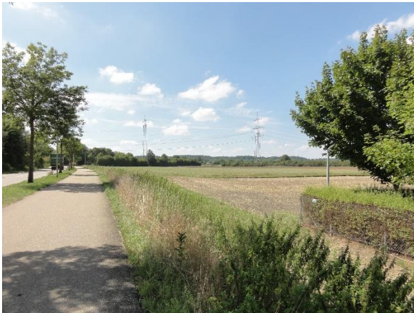
Abbildung 3: Blick in Richtung Westen, links die Werner-von-Siemens-Straße mit Radweg und Gehölzen, rechts die Eingrünung des Hundesportgeländes