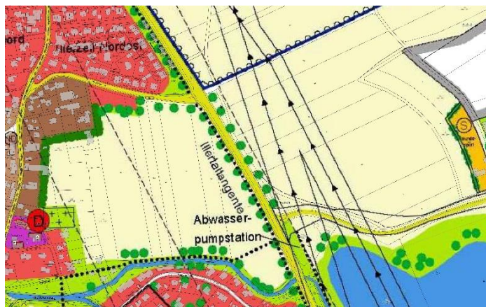
Abbildung 2: FNP-Darstellungen, unmaßstäblich

Der rechtsgültige Flächennutzungsplan der Stadt Vöhringen aus dem Jahr 2019 stellt für den gesamten Geltungsbereich Landwirtschaftsflächen dar. Im Osten schließt eine Mischgebietsfläche (Hundesportplatz) und daran Gewerbeflächen mit entsprechender Nutzung an, im Norden und Westen liegen weitere Landwirtschaftsflächen und jenseits der Illertangente die Ortschaft Illerzell mit weiteren Siedlungsflächen mit Wohn- und Mischgebietsbebauung.