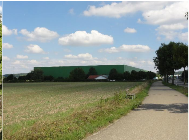
Abbildung 4: Blick in Richtung Nordosten auf die bestehende Gewerbebebauung

Das Gebiet wurde am 16.05.2023 im Rahmen einer artenschutzrechtlichen Relevanzbegehung auf Vorkommen relevanter Arten untersucht, nachfolgend werden die wesentlichen Ergebnisse dargestellt (vgl. auch Bebauungsplan „Gewerbegebiet Werner-von-Siemens-Straße“ – Artenschutzrechtliche Relevanzprüfung, LARS consult, 2023).