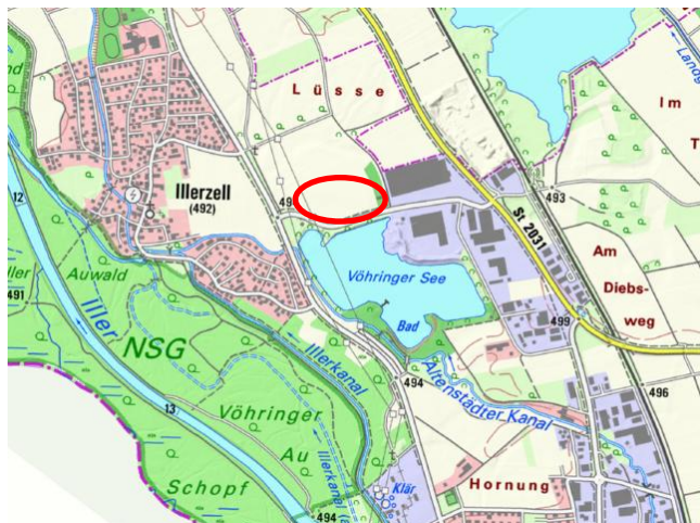
Abbildung 1: Lage des Plangebiets im Untersuchungsraum

Das Plangebiet liegt innerhalb der naturräumlichen Haupteinheit „Donau-Iller-Lechplatten“ (D-64) in der naturräumlichen Einheit des Unteren Illertals nördlich des Vöhringer Sees und östlich von Illerzell, im Landkreis Neu Ulm, Regierungsbezirk Schwaben.