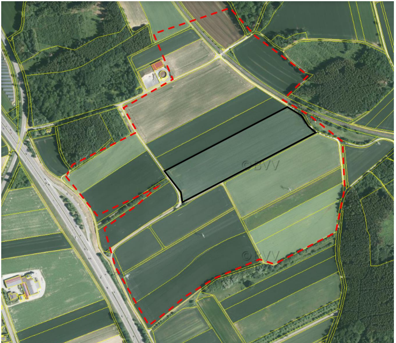
Abb. 1: Lage der Untersuchungsfläche (Rot=Untersuchungsfläche, Schwarz=Geltungsbereich)

Auf der Gemarkung Illerberg soll ein Solarpark entstehen. Das Untersuchungsgebiet wird im Westen von der Autobahn A7 und im Osten von einer Bahnlinie begrenzt. Der überwiegende Teil des Vorhabensgebietes ist von Ackerflächen umgeben. Das vorliegende Projekt umfasst die in der folgenden Abbildung dargestellten Grundstücke. Der Untersuchungsumfang umfasst die Vorhabensfläche und den Wirkbereich von 25m, im Offenland mindestens 150m (Kulissenwirkung Feldlerche).