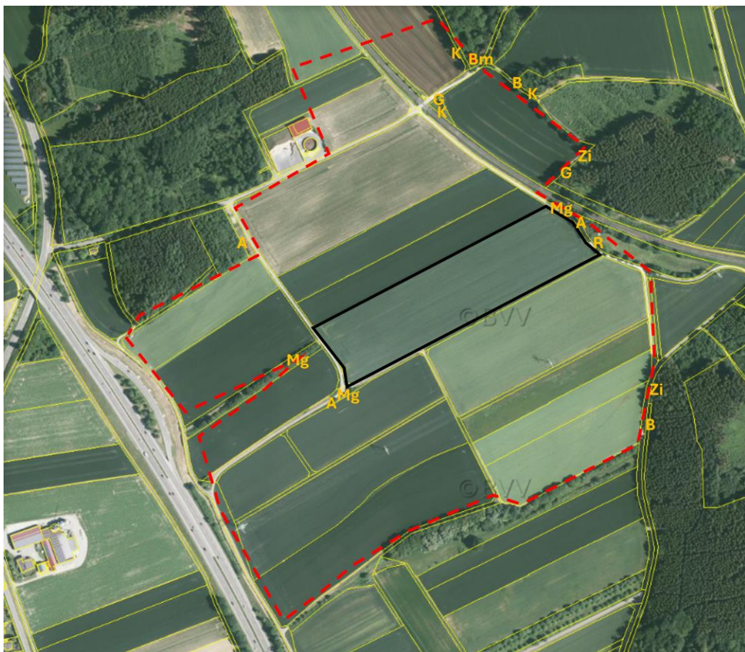
Abb. 4: Brutvögel im Untersuchungsgebiet, Kürzel siehe Tabelle 1 Gehölzbrüter: Gelb (Luftbild: https://geoportal.bayern.de ).

Als Durchzügler bzw. Nahrungsgäste wurden zudem Mäusebussard, Turmfalke, Rotmilan, Rabenkrähe, Blaumeise, Haubenmeise, Tannenmeise, Gimpel und Grünfink beobachtet.